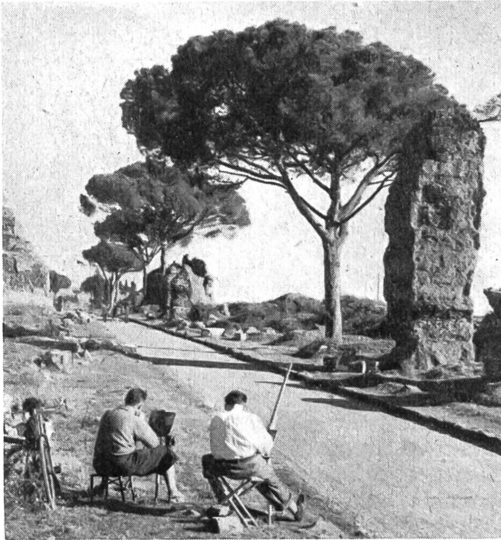
Die malerische römische Via Appia Antica. Ruinen gewaltiger Grabdenkmäler.

Einverleibung der Städte Athen, Rhodos, Pergamon und Alexandria in das Römische Reich Rom zur alleinigen Hauptstadt der antiken Welt geworden war und damit auch den Geschmack und den Baustil bestimmte, erhielt die römische Architektur ein besonderes Gepräge. Es entwickelte sich ein griechisch-römischer Prunkstil, und es entstand eine römische Reichskunst, die gleicherweise den Osten wie den Westen beherrschte. Diese Kunst der Römer stellte den Künstlern und Baumeistern verlockende und dankbare Aufgaben. Sie sollte die Macht, den Einfluss und die Grossartigkeit des Römischen Reiches den unterworfenen Völkern vor Augen führen und die Römer selbst in dem Glauben bestärken, dass ihre Stadt zum caput orbis terrarum , zur Hauptstadt der Welt und zu deren Beherrschung berufen sei. So entstanden die mächtigen Bogen- und Gewölbebauten, die