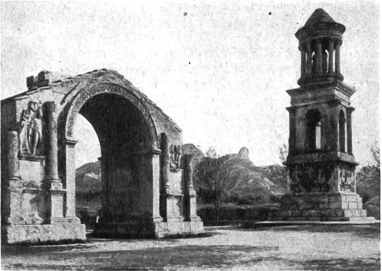
Triumphbogen und Grabmal der Julier bei St. Rémy in der Provence (Südfrankreich). Die alte Römerstadt wurde 480 n. Chr. von den Westgoten zerstört.

baute der Kaiser Hadrian das Pantheon, einen Rundbau, dem die Form einer Kugel zugrundeliegt, was bedeutet, dass die Raumhöhe der Raumweite entspricht. In diesem Tempel wurden alle Götter verehrt, die heimischen wie auch die fremden der unterworfenen Völker, um zu zeigen, dass Rom gewissermassen auch die Hauptstadt der Götter sei. So wurden Rom und im Gefolge der Eroberungen viele andere Städte des römischen Erdkreises mit Tempeln, Marktplätzen, Badehallen (Thermen), Triumphbögen, Grabdenkmälern und Ehrensäulen geschmückt, die noch heute von der Pracht und von der Macht des Römischen Reiches zeugen.