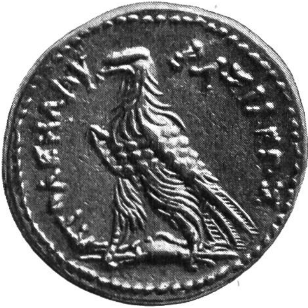
5. Silbermünze des ägyptischen Königs Ptolemäus III., geprägt um 230 v. Chr. (Dm.: 26 mm).