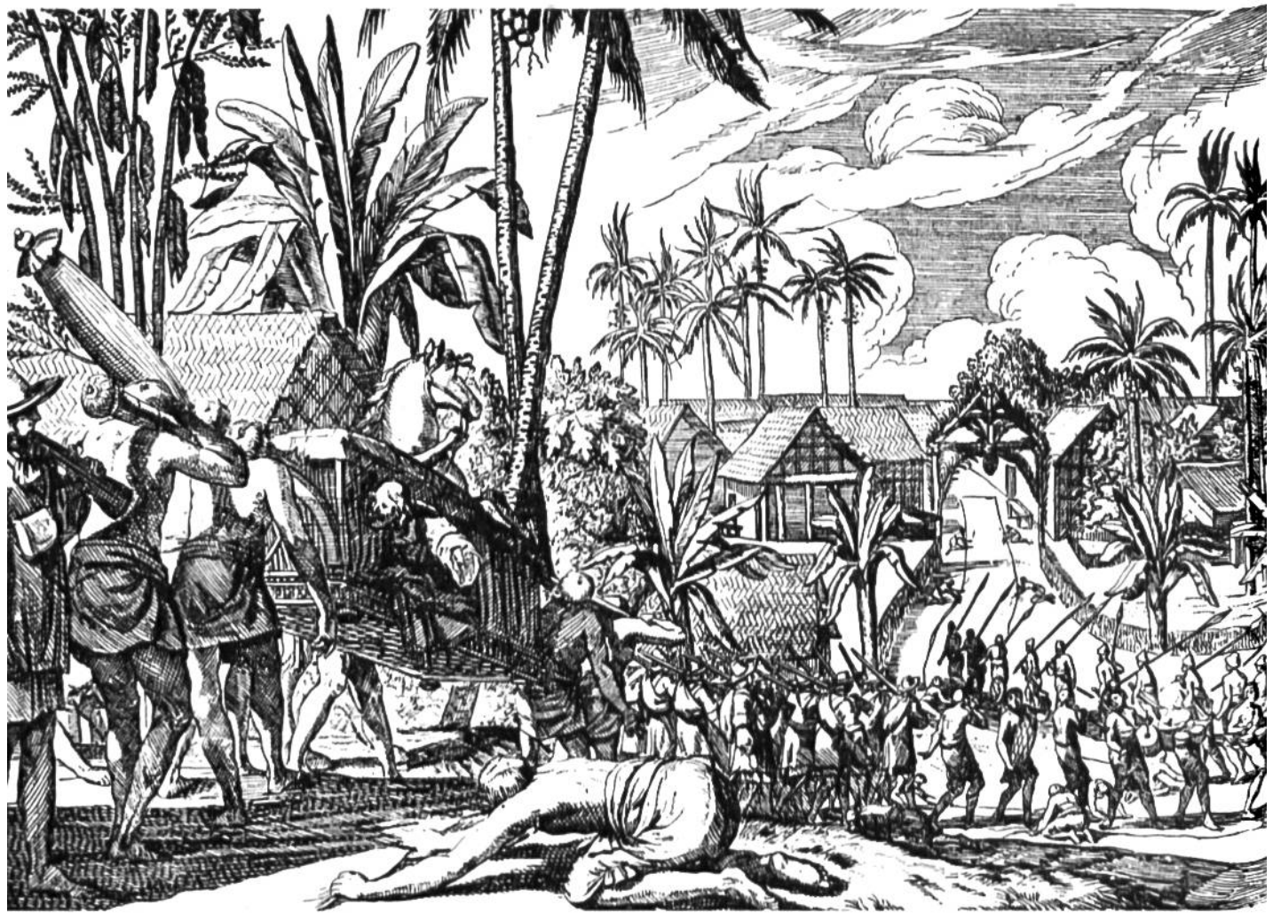
Einzug einer holländischen Truppe in Colombo auf Ceylon am 20. August 1665. Die Einwohner haben den Weg mit weissen Tüchern belegt.

Stadt Cochin, die von den Portugiesen besetzt gewesen war. Eingehend werden die Eingeborenen der Malabar-Küste beschrieben. Desgleichen berichtet Herport über die Insel Ceylon und ihre Bewohner, die er ebenfalls kennenlernte.