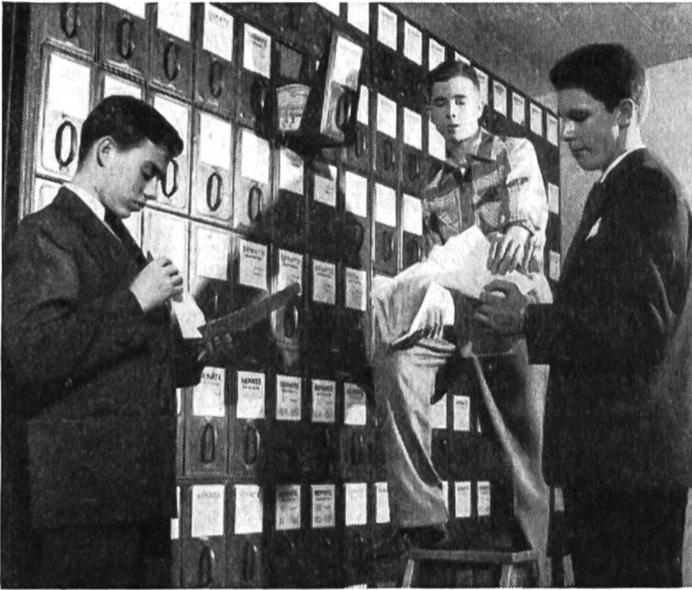
Zwei Pagen holen Rap- porte aus der umfas- senden Kartothek des Staats- gebäudes.

zu spitzen, Dutzende von Notizblöcken und Büroklammern zu verteilen und Zeitungen bereitzulegen. Während der Session, die täglich sechs und mehr Stunden dauern kann, halten sich diese klugen und flinken Pagen in einem Wartezimmer auf, um jederzeit für die Parlamentsmitglieder erreichbar zu sein. H. Sg.