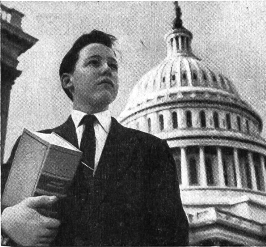
Der fünfzehnjährige Page hat einem Senator ein Gesetzbuch aus der Bibliothek geholt.