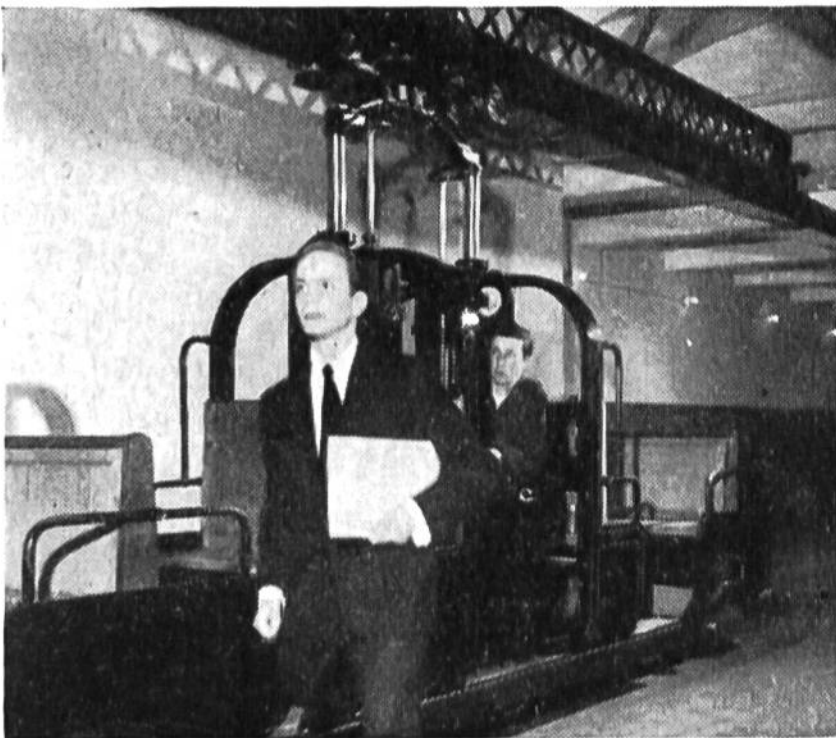
Um die erforderlichen Akten rasch weiterge- ben zu können, benut- zen die Pagen eine be- sondere, unter dem Hause liegende Bahn.

zu spitzen, Dutzende von Notizblöcken und Büroklammern zu verteilen und Zeitungen bereitzulegen. Während der Session, die täglich sechs und mehr Stunden dauern kann, halten sich diese klugen und flinken Pagen in einem Wartezimmer auf, um jederzeit für die Parlamentsmitglieder erreichbar zu sein. H. Sg.