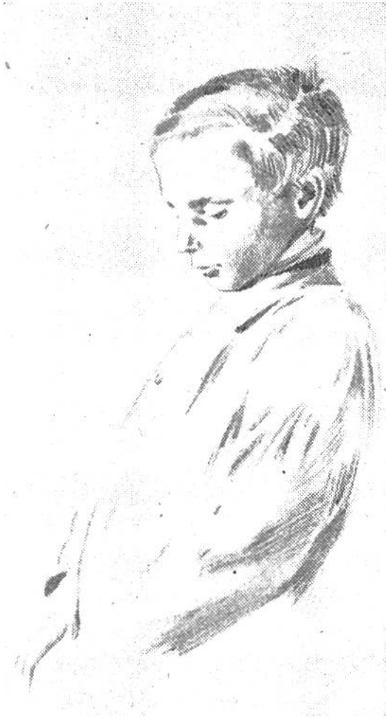
Skizze von Wilhelm Busch.

Bienen, Hunde und Schweine, Käfer und Ameisen – die ganze Belegschaft von Noahs Arche stattet er mit lustigen menschlichen Charakterzügen aus. Er zeigt damit den Menschen im Zerrspiegel der Tierkarikatur. Und dabei will Busch den Leser nicht nur unterhalten und ergötzen; er will ihn ernstlich bessern. Er prangert die Lüge an, bekämpft die weichliche Gefühlsduselei, lobt den Tapferen. Er zeigt in der Fratze des Humors, wie nahe Spiessbürgertum, Eitelkeit, Heuchelei und Liederlichkeit beieinander wohnen («Fromme Helene»), wie grausam und roh Menschen einander wehetun und wie fehlerhaft und unvollkommen das Leben zuweilen durch eigene Schuld eingerichtet ist. Mit listigem Augenzwinkern und mit einem Schmunzeln auf den Lippen erhebt der Dichter den warnenden Finger. «So geht es nicht; man muss es anders und besser machen», warnt er väterlich.