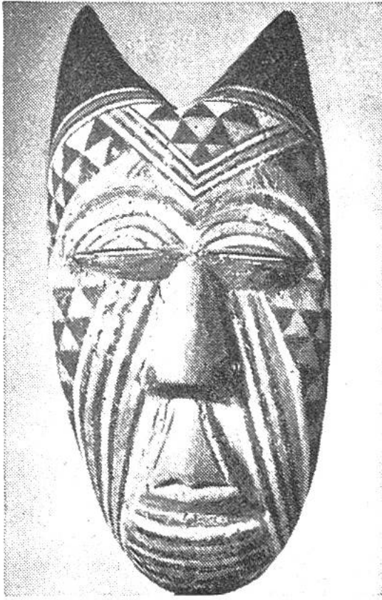
Mehrfarbige Maske aus Belgisch Kongo.