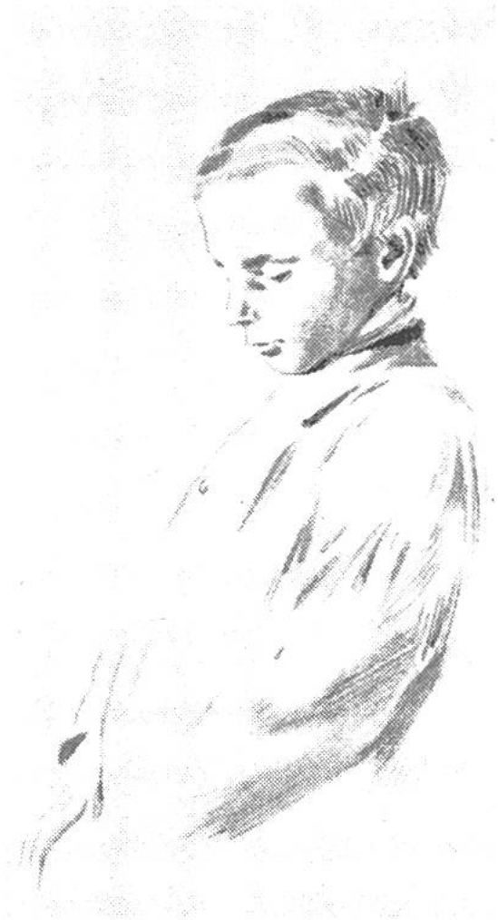
Skizze von Wilhelm Busch.

kommen kann und schliesslich von der Katze gefressen wird. Aber der Dichter Busch verzweifelt nicht. Sein Lachen und sein Humor überwinden die Macht der Welt – er singt (wie der Vogel auf dem Leim).