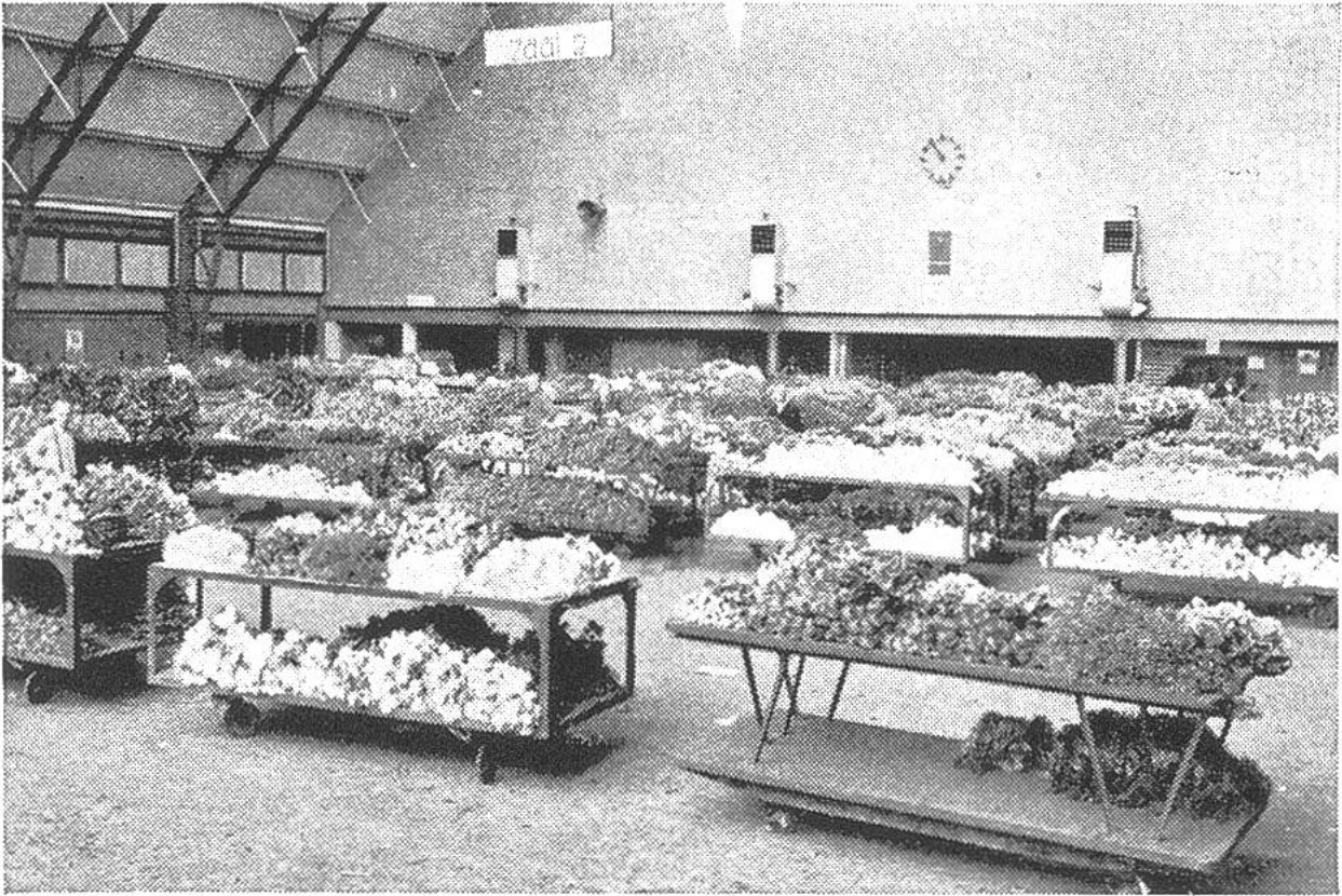
In einer der fünf grossen Hallen von Aalsmeer (Holland) sind die Schnittblumen auf fahrbaren Tischen zur Besichtigung aufgestellt.

sich gegenüber der Tribüne befindet, setzt sich in Bewegung, indem er erst einen überdurchschnittlich hohen Preis anzeigt und dann absinkt. Sobald ein Käufer die Ware zu dem gerade angezeigten Preis kaufen möchte, drückt er auf den Knopf an seinem Platz, die Uhr bleibt stehen und die Nummer des Käufers leuchtet auf. Die Uhr reagiert auf einen Unterschied von nur \frac{1}{20} Sekunde, so dass die Gefahr praktisch ausgeschaltet ist, dass zwei Käufer zur genau gleichen Zeit auf den Knopf drücken. Würde der Käufer noch länger zuwarten, so könnte er die Ware billiger erhalten, riskiert jedoch, dass ihm ein anderer Käufer zuvorkommt und er infolgedessen leer ausgeht. Die Ware muss meistens bar bezahlt und sofort mitgenommen oder weggeschickt werden.