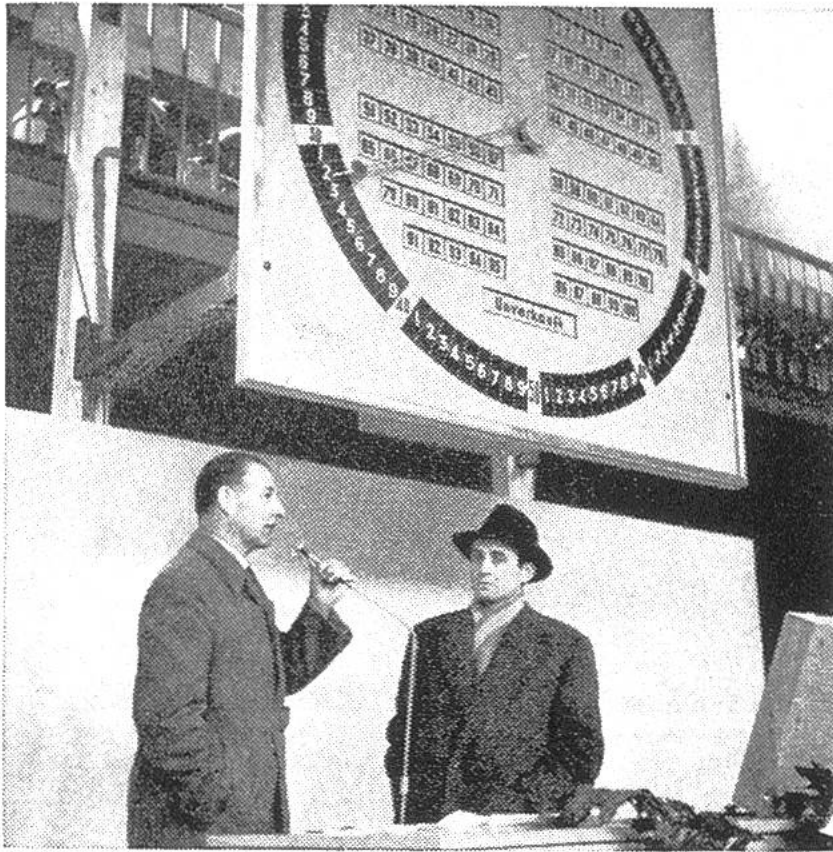
Die Versteigerungsur in Burgdorf zeigt aus- sen die Zahlen für die Preise, innen die Num- mern der Käufer.

In der Schweiz ist eine derartige Versteigerung für Obst und Gemüse «über die Uhr» zum erstenmal im Herbst 1956 in Burgdorf durchgeführt worden. Der Erfolg war so gut, dass die Einführung dieser Methode für 1957 beschlossen wurde. Für Blumen hat sich jedoch vorläufig ein anderes Verkaufssystem auf genossenschaftlicher Grundlage, die «Blumenbörse» in Zürich, als zweckmässiger erwiesen.