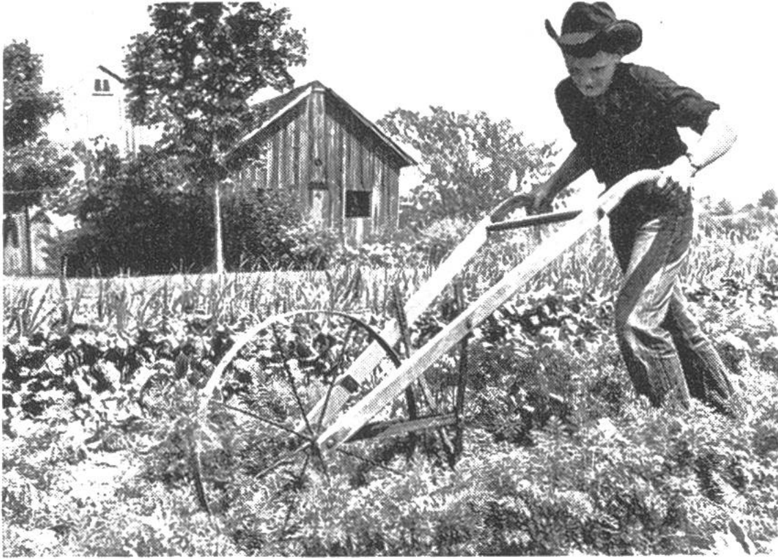
Mit dem Kultivator hackt der Farmerbub seine Rübli selbst.

Hauswirtschaft behandelt werden. Von Zeit zu Zeit gibt es sogar eigentliche Wettkämpfe, wobei sich für das beste, selbst aufgezogene Kalb, für die mit dem Traktorpflug am schönsten gezogenen Furchen oder für eine im Wettstreit unter Mädchen zubereitete Mahlzeit hübsche Preise gewinnen lassen. Diese Veranstaltungen spornen Buben und Mädchen dazu an, es womöglich auch einmal bis zum Preisträger, dessen Bild natürlich in der Landjugendzeitung erscheint, zu bringen. Verständige Eltern wissen den Wert der 4-H-Clubs zu schätzen und lassen ihre Jungen, auch wenn im Übereifer manchmal etwas in die Brüche geht, gerne gewähren.