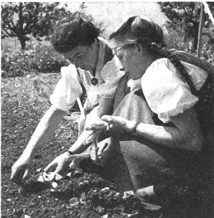
Das junge Mädchen darf lernen zu säen und zu setzen; dabei erwacht auf einmal die Freude an der Gartenarbeit.

lichst viele eigene Produkte zu verwenden. Darum gehört zu einem Bauernhaus auch ein Garten, in welchem vom Frühling bis zum Herbst gesät, gesetzt, gepflegt und geerntet wird. Welche Freude, das Gemüse frisch auf den Tisch bringen zu können! Aber auch Blumen aller Arten blühen im Bauerngarten und an den Fenstern; die Freude am Schönen ist der Bauernfrau angeboren, darum findet sie auch beim strengsten Werchen noch Zeit, ihre Blumen zu pflegen. Die Bauernfrau ist eine Königin in ihrem kleinen Reich.