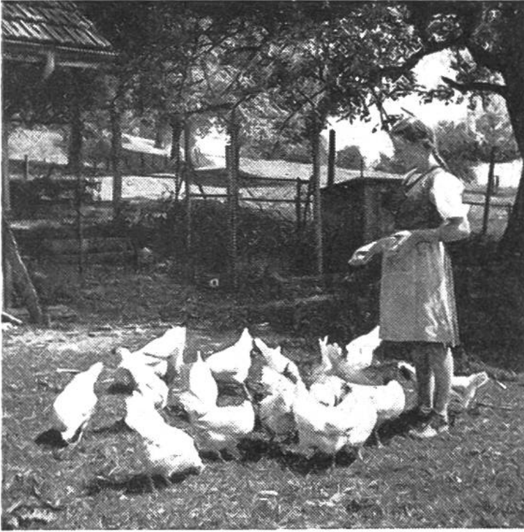
Die Lehrmeisterin überlässt der Lehrtochter möglichst bald die Verantwortung für die Betreuung der Hühner.