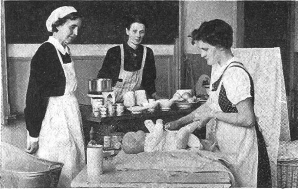
Ein wichtiges Fach an der Berufsprüfung: Säuglingspflege.

Nach der Schule folgen einige Jahre praktischer Arbeit im eigenen oder in fremden Betrieben. Viele Mädchen gehen während dieser Zeit einmal als Praktikantin ins Ausland, vielleicht nach Dänemark, Holland, Norwegen oder Schweden. Es ist für die angehende Bäuerin eine Bereicherung, wenn sie Gelegenheit hat, sich ein wenig in der Welt umzusehen.