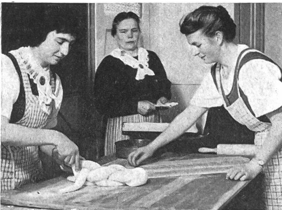
Unter den Augen der gestrengen Expertin wird der Eierzopf kunstgerecht geflochten.

Den Abschluss der beruflichen Ausbildung der Bäuerin stellt die