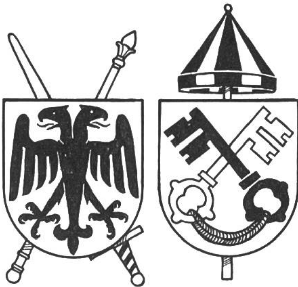
Die Wappen von Kaiser und Papst