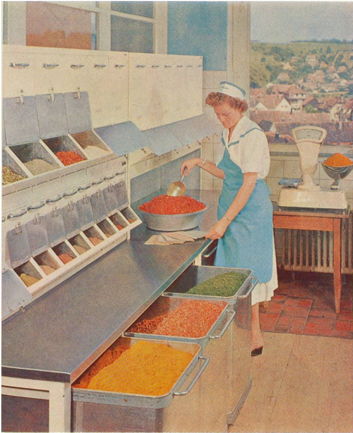
Moderne Gewürzkammer mit Gewürzen und Kräutern aus aller Welt, die zur Herstellung von Suppenprodukten gebraucht werden.