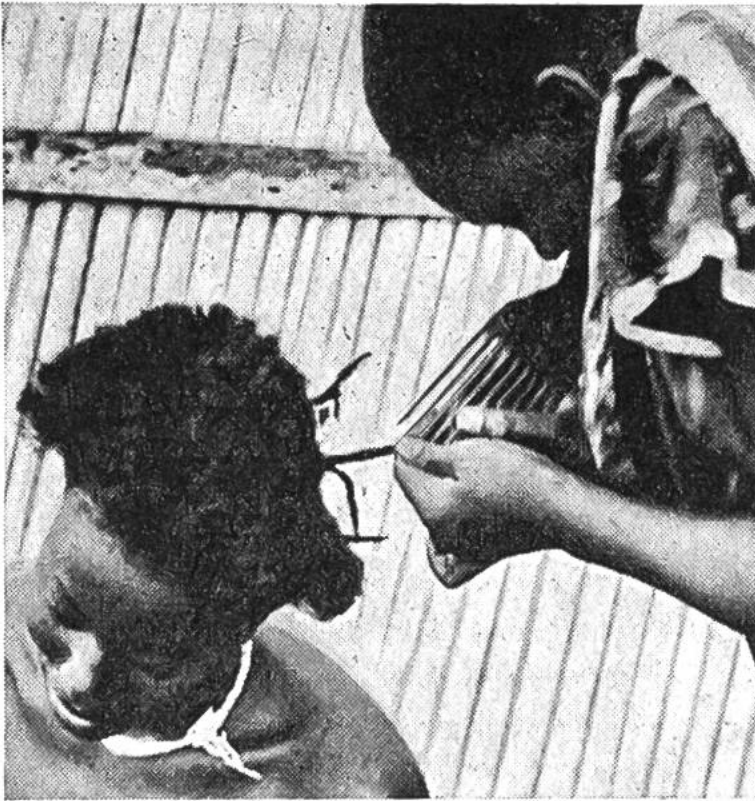
Was lässt sich mit einem langzahnigen Kamm nicht alles künsteln!

seinem Haar sitze, so wird das Abschneiden von Haaren eine gefährliche Sache. Naturvölker fürchten sich besonders, die abgeschnittenen Haarlocken liegenzulassen; denn ein persönlicher Feind könnte sie ja erwischen und damit einen Zauber anstellen, durch den ihm ein Unglück zustossen möchte oder durch den er krank würde. So ist die Haarpflege bei den Naturvölkern manchmal doch mehr als Mode und reicht in die religiösen Vorstellungen hinein. ph.