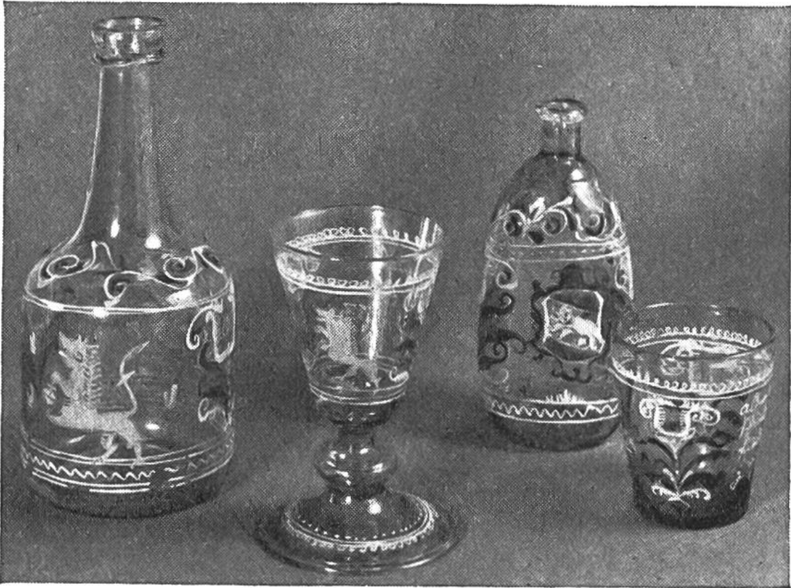
Bunt bemalte Flaschen und Gläser aus Flühli im Entlebuch, 18./19. Jahrhundert.

waren neben den dünnen, fein geblasenen kelchartigen Gläsern solche mit feiner Ätzung oder einem geschliffenen Dekor sehr beliebt. Als Motive kamen modische Ornamente mit Girlanden, Roccaillen, Gitter- und Pflanzenwerk in Betracht. Mit besonderer Vorliebe, und oft wohl auch als Scherz gemeint, wurde der Schnaps aus Flaschen, die einem Hunde ähnlich sahen, getrunken. In ländlichen Gegenden schätzte man wohl mehr das buntbemalte Glas aus Flühli im Entlebuch. Dies war meist 2- bis 4farbig und mit einfachen Spiral- oder Bandornamenten sowie mit Tieren bemalt. Im Bernbiet fiel die Wahl natürlich auf den Bären, in Zürich dagegen gab man dem Löwen den Vorzug. R. L. Wyss