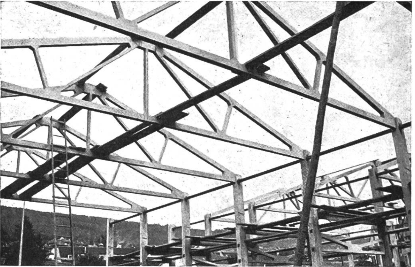
Hallenkonstruktion aus vorgefertigten Betonelementen.

Hauptsache aus Quarz und andern schwer angreifbaren Mineralien. Abgeschliffene Gesteinstrümmen, vorwiegend Quarz und Alpenkalk mit einer Korngrösse von 5–60 mm, bilden das Kies. Diese Zuschlagstoffe werden im Kieswerk mit den modernsten Maschinen und Einrichtungen ausgebeutet. Die einzelnen Körner fallen unter Ausnützung der Schwerkraft von Maschine zu Maschine, werden gewaschen und aussortiert. Moderne Gewichts-dosieranlagen gestatten nachher wiederum, genaue Mischungen zu erstellen.