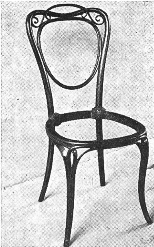
«Thonet»-Stuhl ohne Sitzfläche aus dem Jahre 1836. (Technisches Museum Wien.)

Überall in der modernen Bauweise ist das vorgefabrizierte Betonelement sehr geschätzt, hat es doch seine Eignung glänzend bewährt. Beton ist nicht nur feuersicher, rostfrei und wetterfest, sondern auch sehr gefällig im Aussehen und vielfältig in den Anwendungsmöglichkeiten. Kurze Lieferfristen und rasche Montage ermöglichen eine sehr schnelle Bauweise; dadurch wird vielfach auch eine enorme Baukostensenkung erreicht. Dank den hervorragenden Eigenschaften des guten Betons werden noch nach Jahrzehnten, ja nach Jahrhunderten die kommenden Generationen Zeugen unseres Schaffens sein.