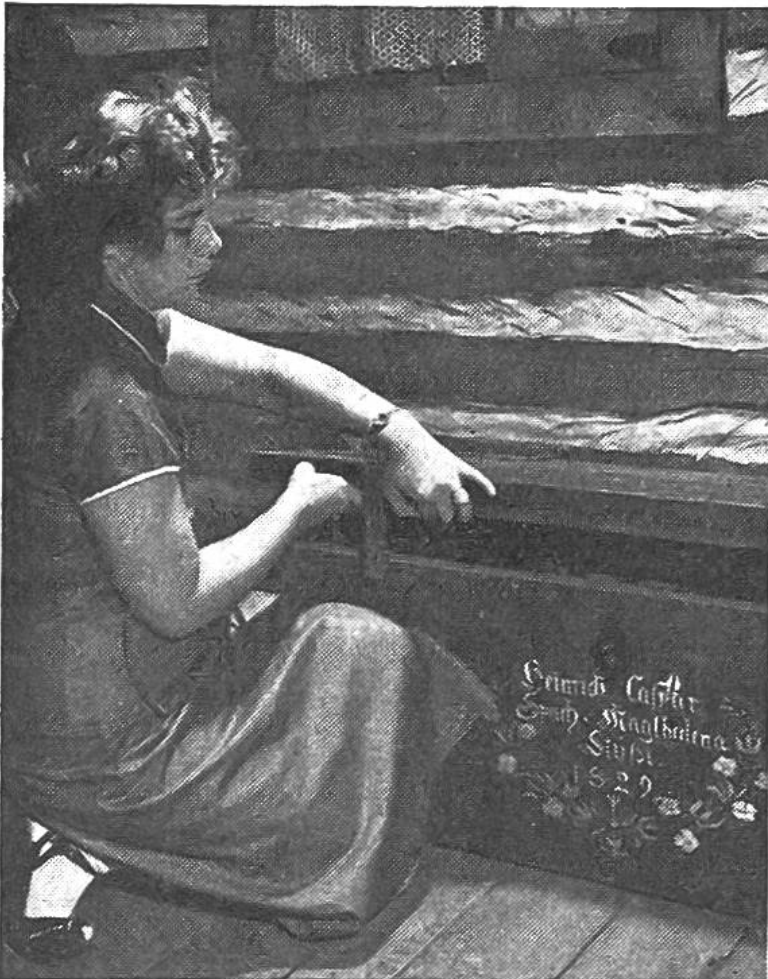
In schweren Holztruhen schleppten die Einwanderer ihre Kleider und Geräte nach Amerika. Eine Truhe aus dem Jahre 1829 ist noch heute im Museum zu sehen.