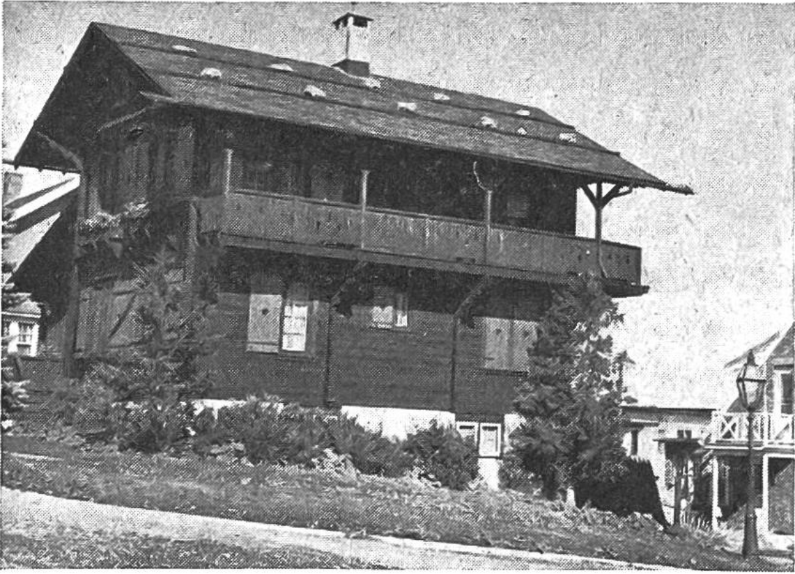
8000 km von der Schweiz entfernt steht dieses Chalet inmitten der Kleinstadt Neu-Glarus.