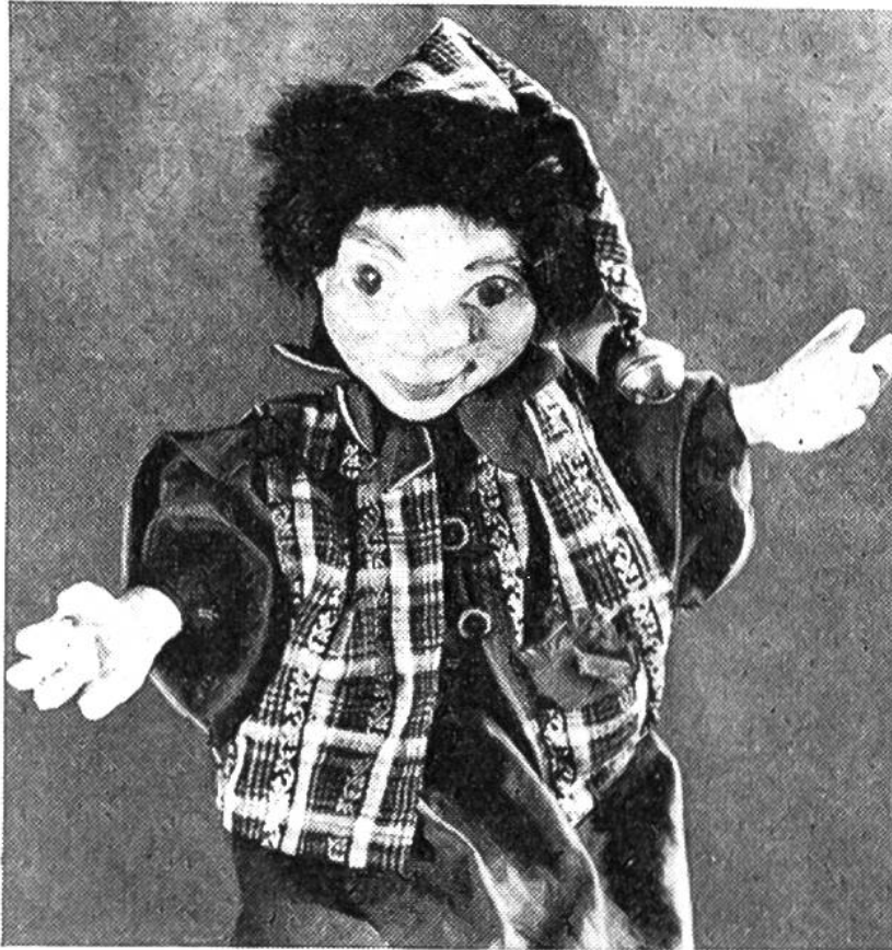
Der Kasperli begrüsst die Zuschauer.