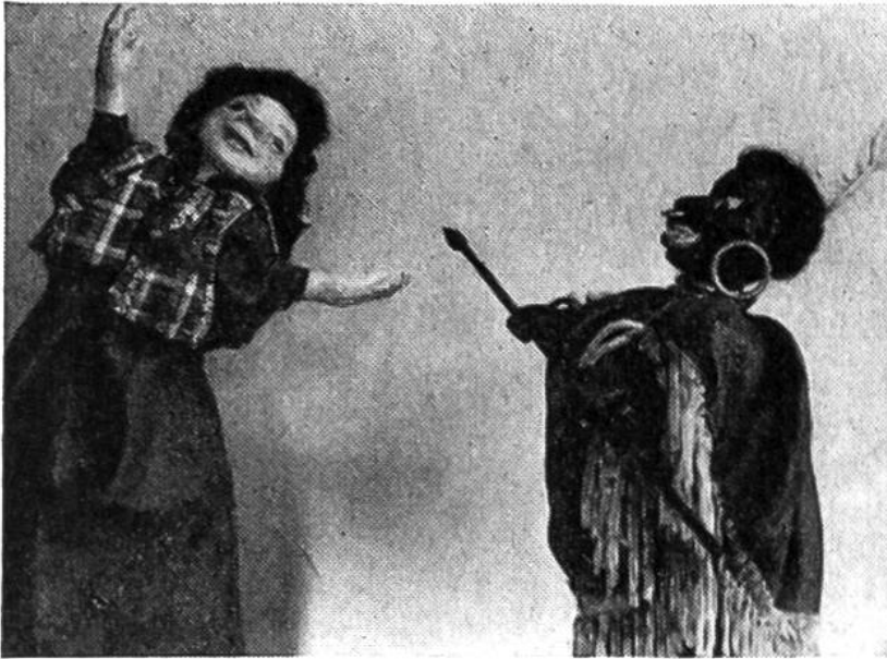
Dramatisches Zusammentreffen mit dem Negerhauptling.

Figuren mit ihren aufgemalten und geschnittenen kostbaren Kleidern und werden von unten her an feinen Stabchen, die bis zum Kopfe laufen, seitwarts hin- und hergefuhrt. Die Gesichter sind nur eine angedeutete Profillinie, gleichsam ein geistiges Gegenstuck zum usserlich reichen Gewand. Auch in Java und in der Turkei werden ahnliche Figuren zum Theaterspielen, oft zu kultischen Zwecken, hergestellt. Vielleicht entdeckt ihr solche in eurem Museum? Aus Java stammt ebenfalls die Stockpuppe, ein