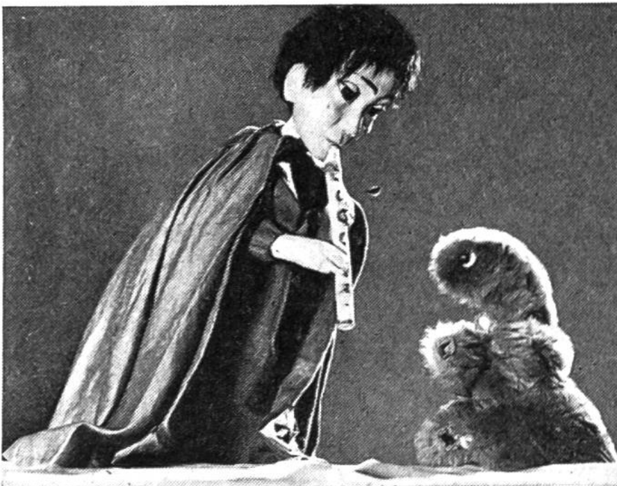
Hier gibt es gar eine Verzauberung!

Figuren mit ihren aufgemalten und geschnittenen kostbaren Kleidern und werden von unten her an feinen Stabchen, die bis zum Kopfe laufen, seitwarts hin- und hergefuhrt. Die Gesichter sind nur eine angedeutete Profillinie, gleichsam ein geistiges Gegenstuck zum usserlich reichen Gewand. Auch in Java und in der Turkei werden ahnliche Figuren zum Theaterspielen, oft zu kultischen Zwecken, hergestellt. Vielleicht entdeckt ihr solche in eurem Museum? Aus Java stammt ebenfalls die Stockpuppe, ein