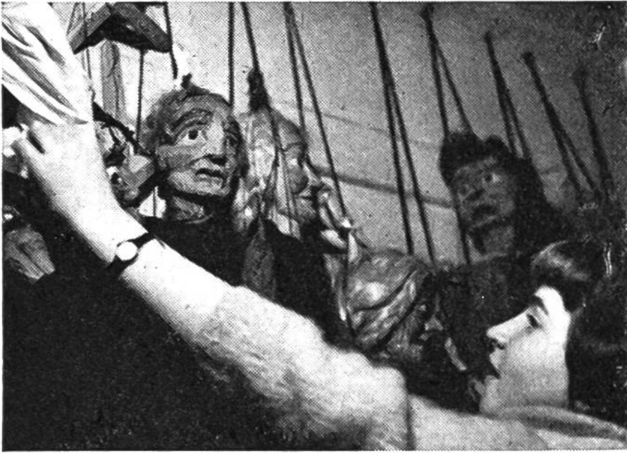
Die Marionetten warten auf ihren Auftritt.

Vorläufer unseres Kasperli. Ein geschnitzter, interessanter Kopf sitzt auf einem ungefähr 40 cm hohen Stock, der vom Gewande verdeckt ist und von unten her geschoben wird.