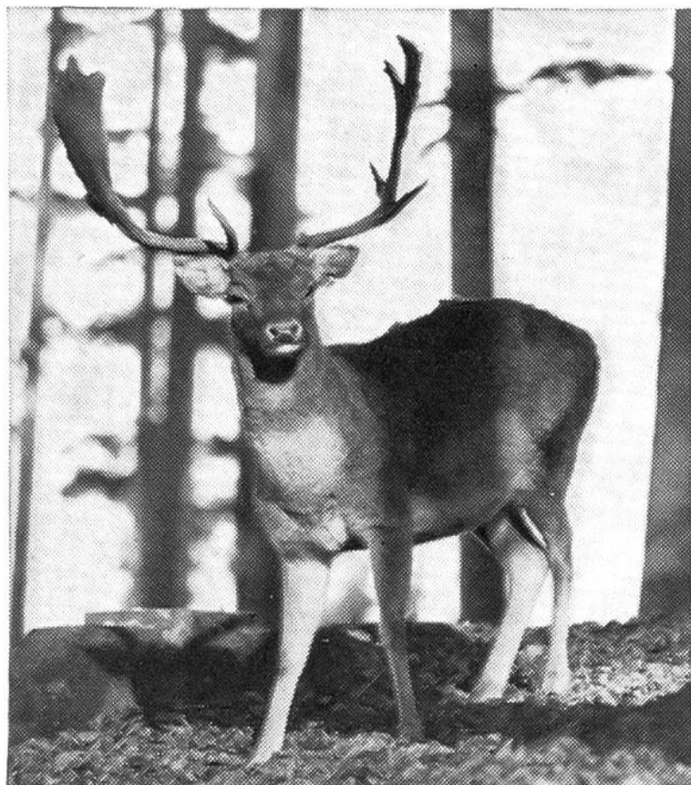
Un magnifico esemplare di cervo nel parco di Langenberg nel Canton Zurigo.

Ora, con l'addensarsi delle abitazioni, con l'ammucchiarsi degli uomini nei centri, questa vita agreste va sempre più diminuendo: nelle odierne costruzioni di cemento non esiste più nemmeno il posto per i topi domestici, data la sparizione dei locali di dispensa, i tetti piani impediscono ai pipistrelli di rifugiarsi tranquilli, le cantine sono adibite ai più svariati macchinari.