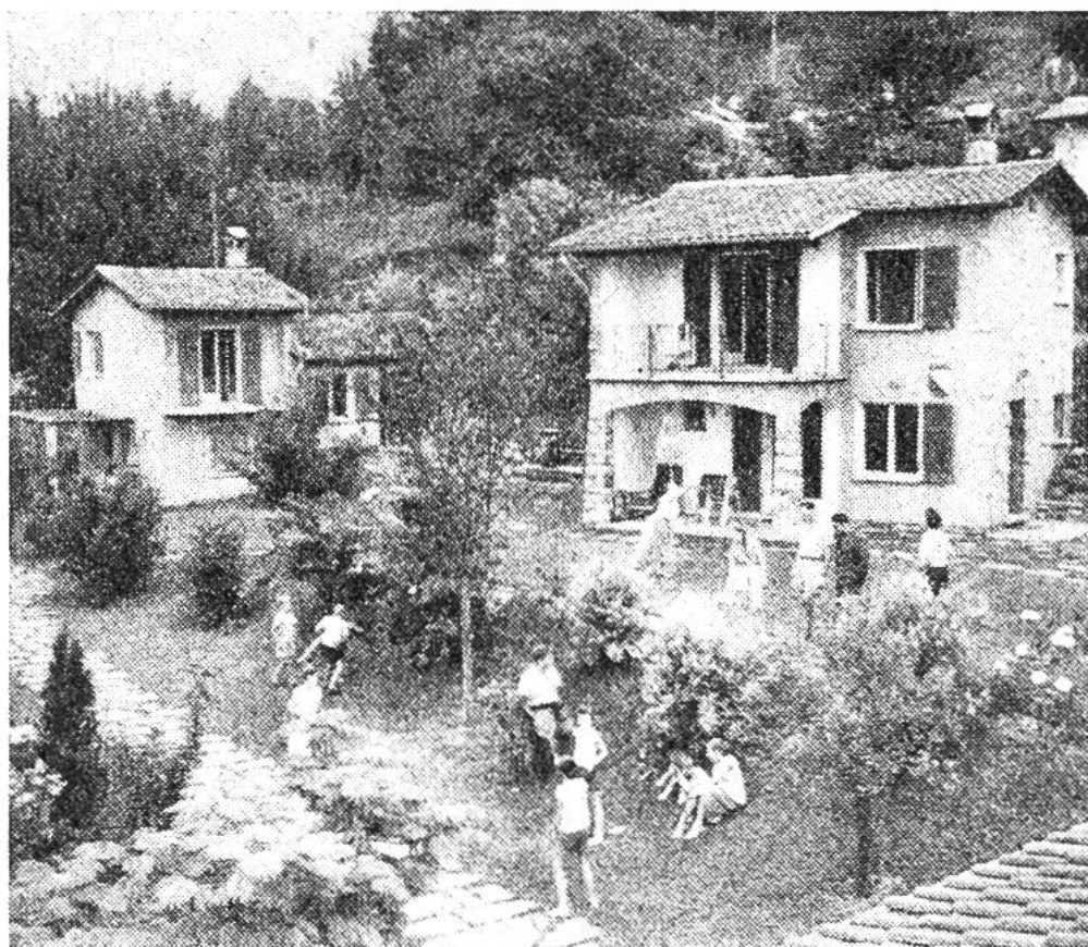
Das Kinderparadies Albonago (s. auch Seite 162).

aus finanziellen Gründen noch nie gemeinsame Ferien leisten konnten. Die Zahl der begünstigten Familien ist bereits auf 2500 angestiegen. Zur Unterbringung dieser Familien, denen auch die Reise bezahlt und ein nach Kinderzahl abgestuftes Taschengeld überreicht wird, wurde das «Feriendorf der 25 Kantone für kinderreiche Familien» in Albonago ob Lugano erbaut. Im vergangenen Jahr konnten nahezu 200 mit Gratisferien bedachte Familien ihren Aufenthalt in einem der mit den Wappen unserer 25 Kantone und Halbkantone geschmückten Ferienhäuschen verbringen. Ein Gemeinschaftshaus, in dem auf Wunsch und zur Entlastung der Mütter die Kinder tagsüber betreut werden und das abends den Erwachsenen für gesellige Zusammenkünfte zur Verfügung steht, ein Schwimmbad und Spielplätze ergänzen die Ferienhäuschen auf schönste Weise und machen Albonago zu einem beliebten Ferienzentrums. Für die restlichen Familien, die ihre Ferien nicht im Tessin verbringen wollen oder können, mietet die Reisekasse geeignete Wohnungen in den verschiedenen Fremdenverkehrsgebieten unseres Landes.