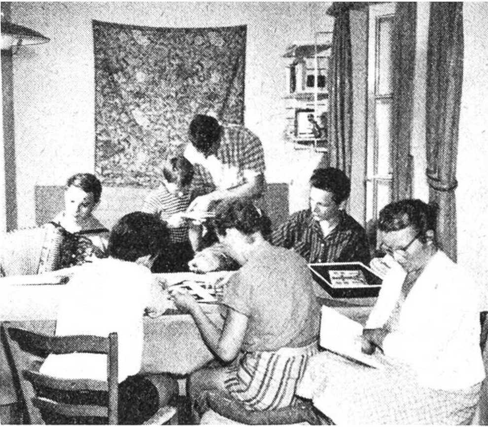
Familienferien in Albonago.

Die «Aktion verbilligte Ferienwohnung» bezweckt ihrerseits eine gezielte Vermittlung von preislich günstigen Wohnungen, wobei die Zuteilung nach dem Grundsatz erfolgt, dass die finanziell schwächere und kinderreichere Familie stets den Vorzug hat. Mit dem Feriendorf Albonago, das ausserhalb der Schulferienzeit ebenfalls zu dieser Aktion gezählt werden muss, verfügt die Reisekasse zurzeit über 110 Wohnungen im Tessin, im Berner Oberland, im Emmental, im Berner Jura, in der Zentral- und Ostschweiz, in Graubünden, im Wallis und in Leysin. Der Erfolg dieser Aktion zeigt, dass sie einem wirklichen Bedürfnis entspricht. Es überrascht nicht, dass die Idee der Reisekasse immer mehr Freunde gewinnt. Über 220000 Mitgliederfamilien haben sich ihr seit ihrer Gründung im Jahre 1939 angeschlossen. Die Summe der jährlich vorgesparten Reisemarken beträgt rund 50 Millionen Franken, die darauf gewährte Verbilligung über 6 Millionen Franken. Mitglied der Reisekasse wird man durch Bezahlung eines einmaligen Beitrages von Fr. 7.-. Als Gegenleistung erhält das neue Mitglied das reich illustrierte Ferienbuch der Schweiz, ein erstes Reiseheft und dann alljährlich gratis den Ferienführer.