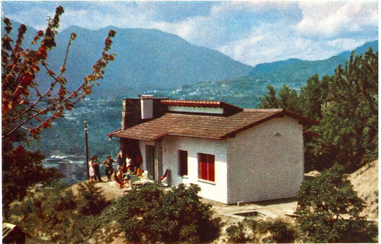
Die «Casa Sciaffusa» im Feriendorf der 25 Kantone in Albonago ob Lugano, das die Schweizer Reisekasse speziell für Ferienaufenthalte kinderreicher Familien erbaut hat.