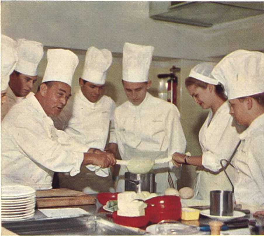
Anschauungsunterricht im Küchenkurs der Hotelfachschule Lausanne.