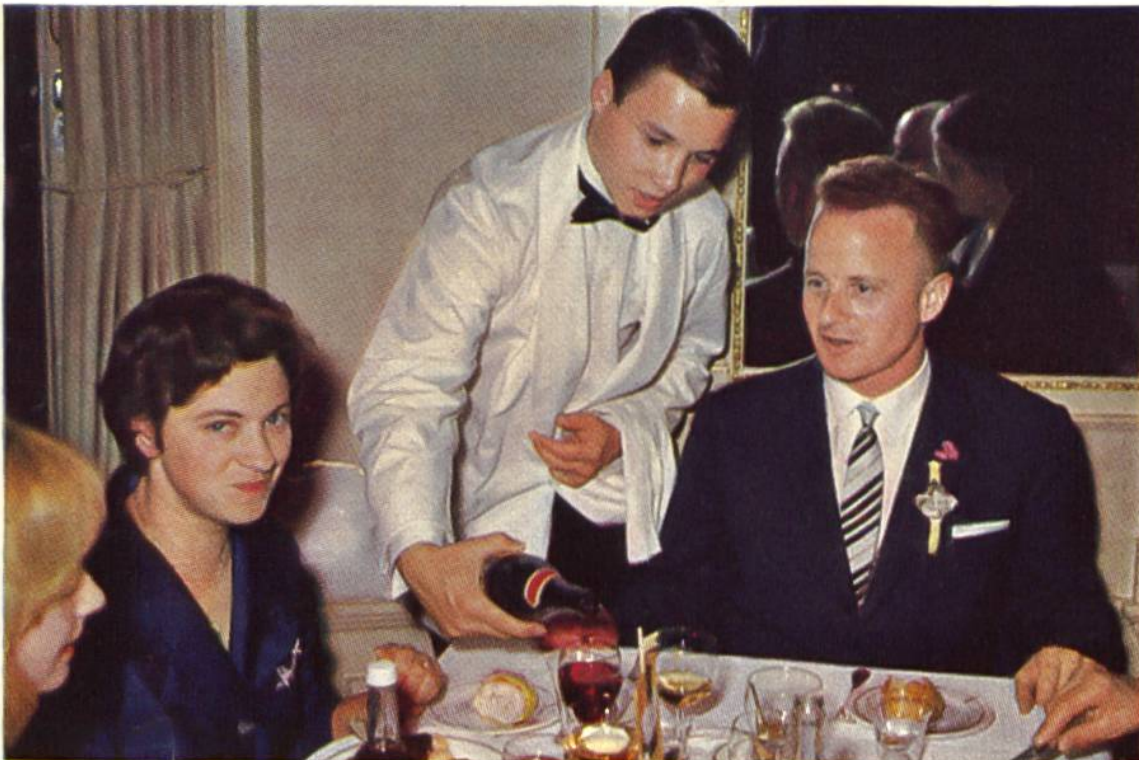
Ein Schüler des Servicekurses beim Einsatz in der Praxis.