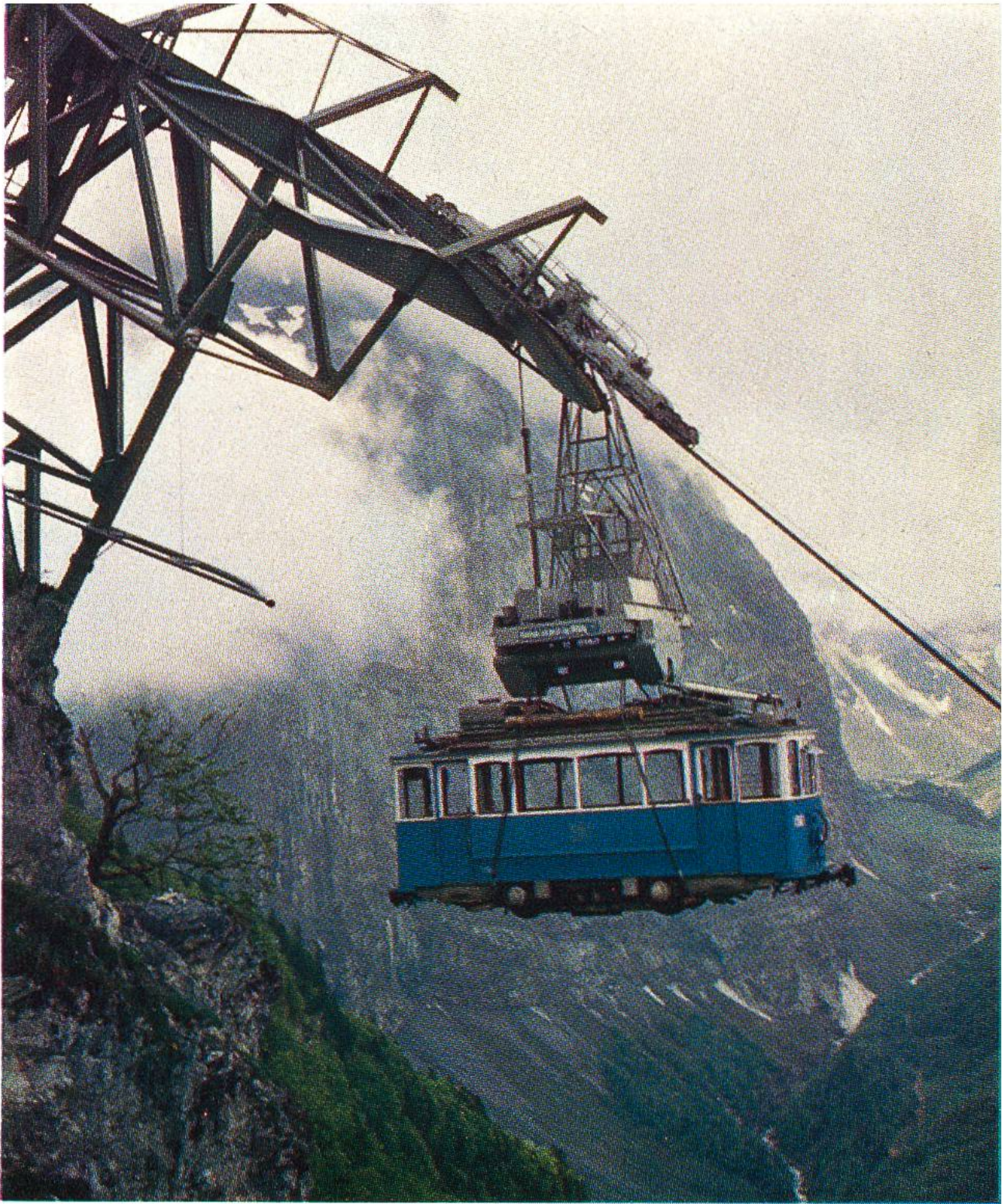
Schwerlastseilbahn Tierfehd (Kraftwerke Linth-Limmern) transportiert einen Zürcher Tramtriebwagen auf die Höhe der Baustelle.