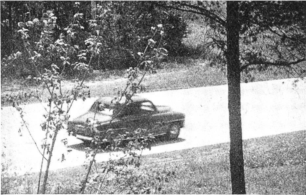
Neun Meter breite Autostrasse Bern-Biel bei Lyss.

Hindernisse auf grössere Entfernung erkennen. Auch bei Nacht und Nässe spiegeln Betondecken nicht. Die Wirkung der lastenverteilenden Platten sichert der Betondecke grosse Tragfähigkeit.