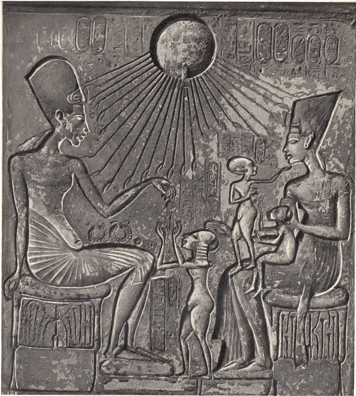
Ägyptische Königsfamilie, Kalksteinrelief von El-Amarna, um 1800 v. Chr. (Ägyptisches Museum, Kairo)