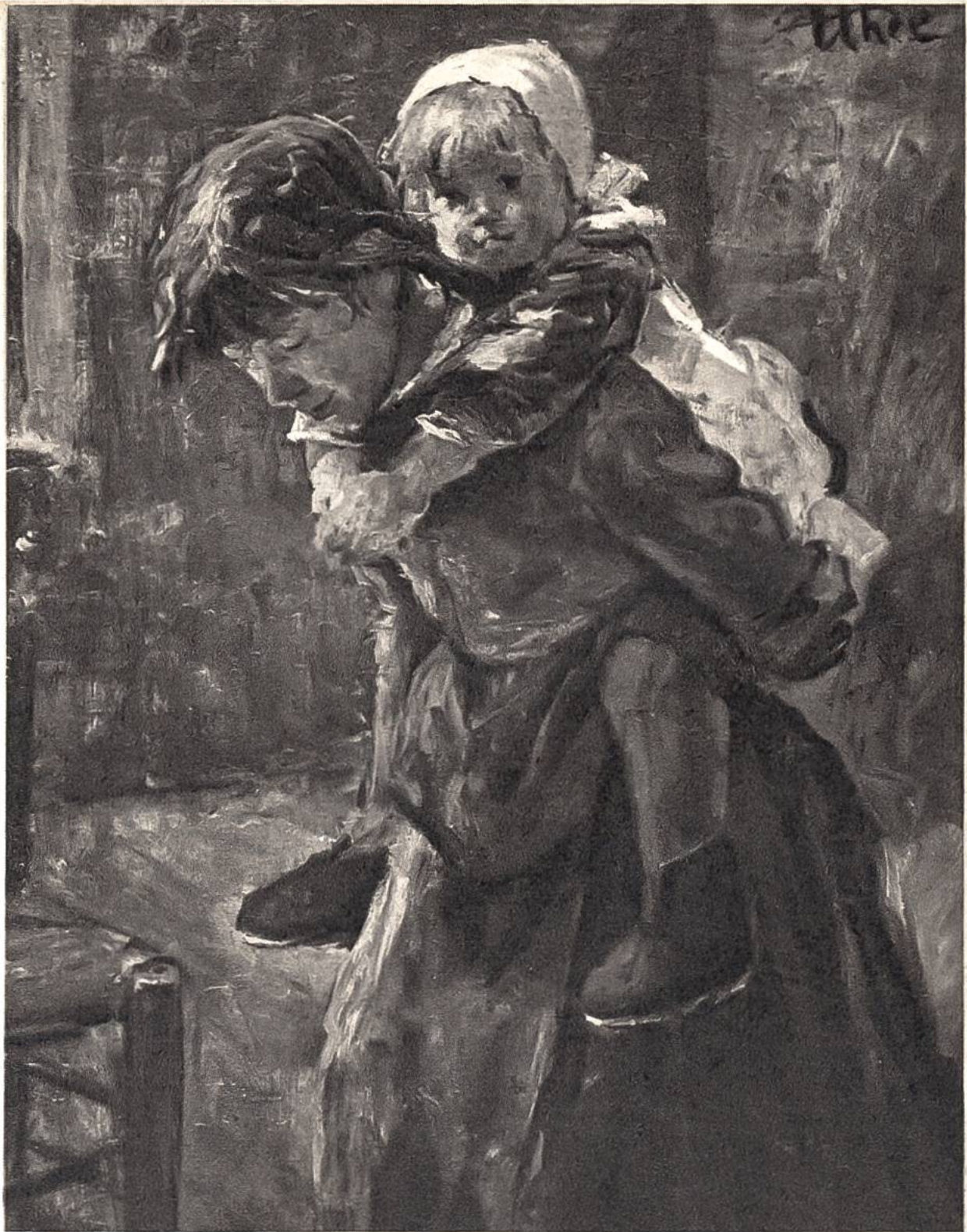
Die grosse Schwester, von Fritz von Uhde, München, 1848–1911. (Stiftung Oskar Reinhart, Winterthur)