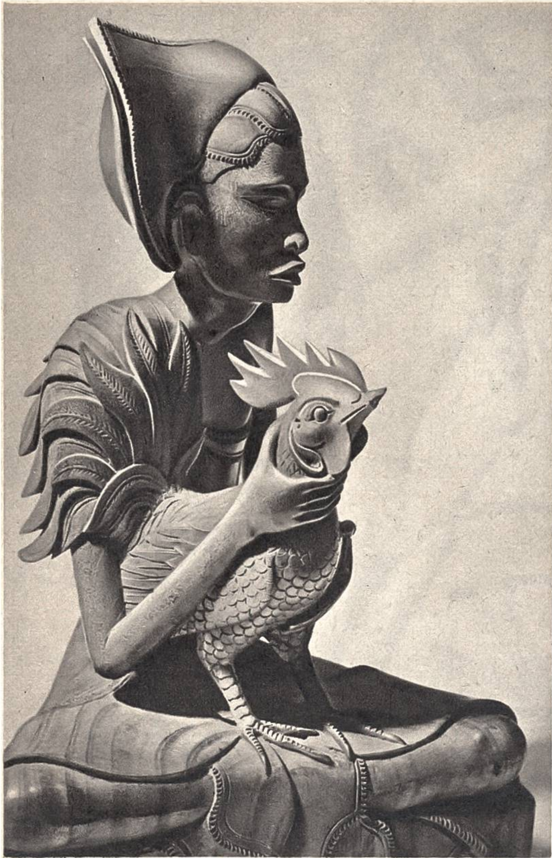
Mann mit Kampfhahn. Moderne Holzplastik aus Bali, Indonesien. (Tropenmuseum, Amsterdam)