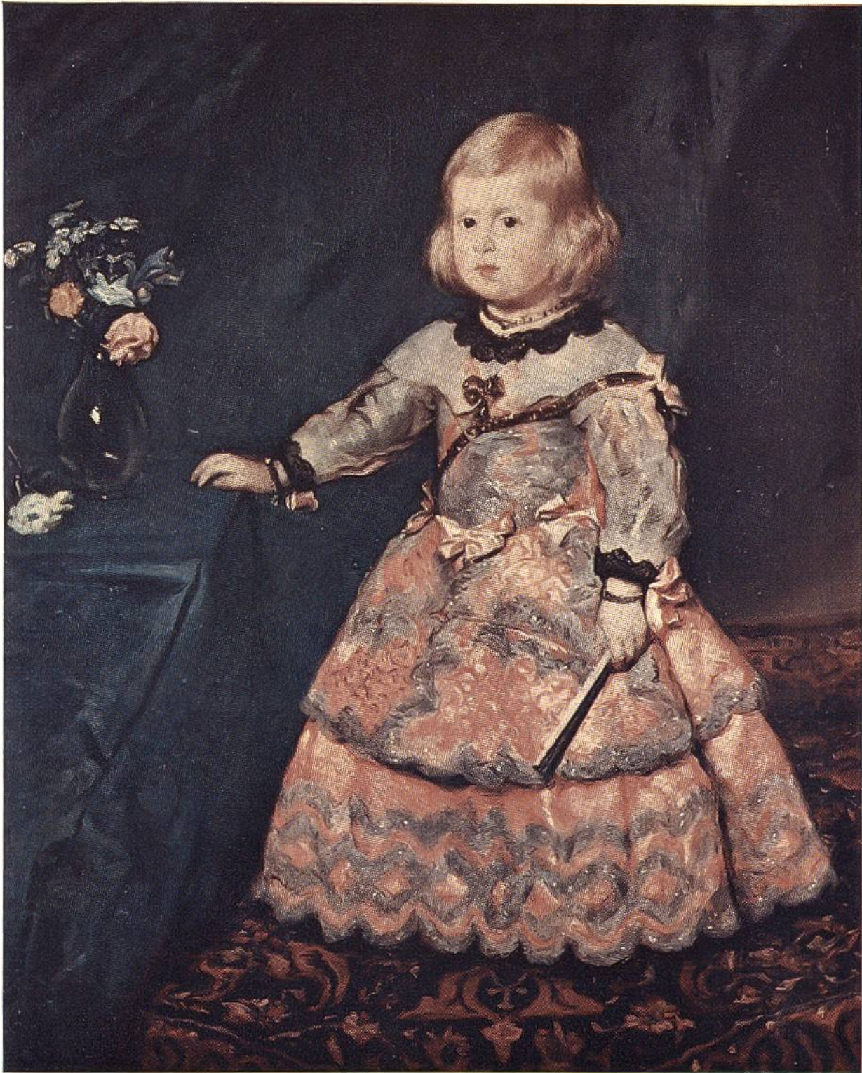
Infantin Margarete, von Diego Velazquez, Sevilla, 1599–1660. (Kunsthistorisches Museum, Wien)