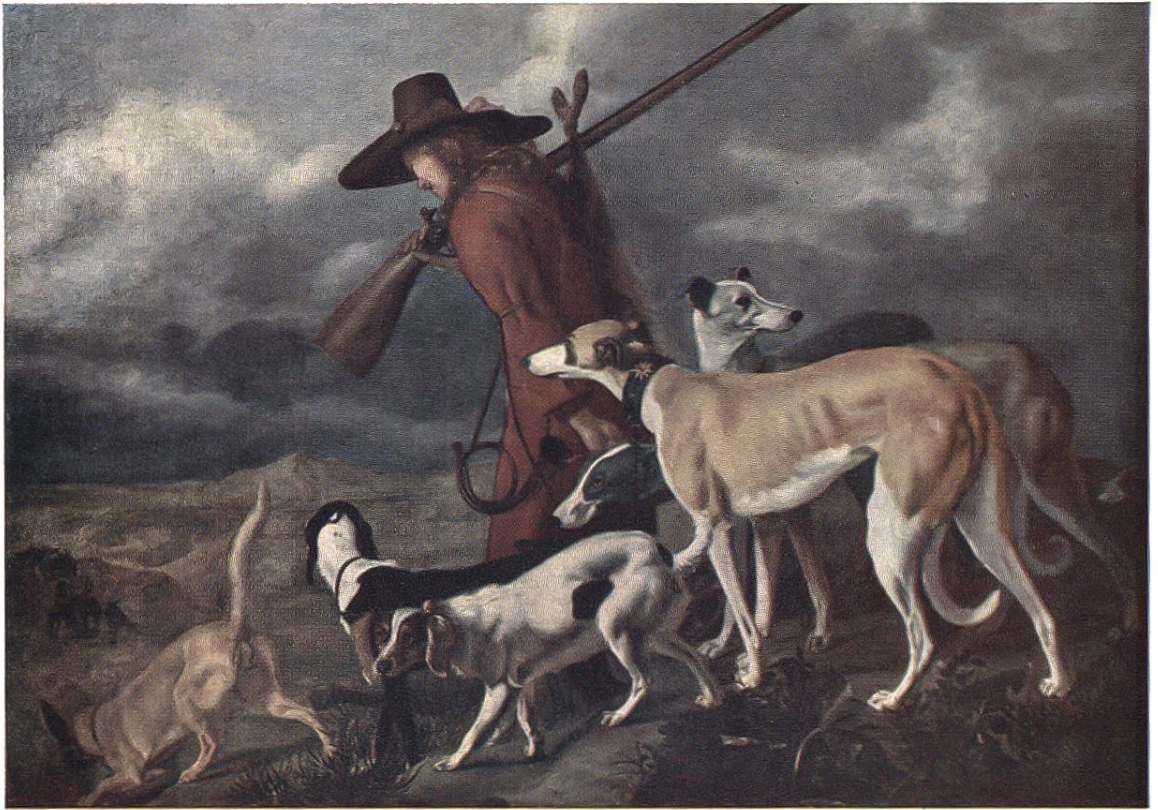
Der Jäger, von Adriaen Cornelisz Beeldemaeker, Den Haag, 1618?–1709. (Rijksmuseum, Amsterdam)