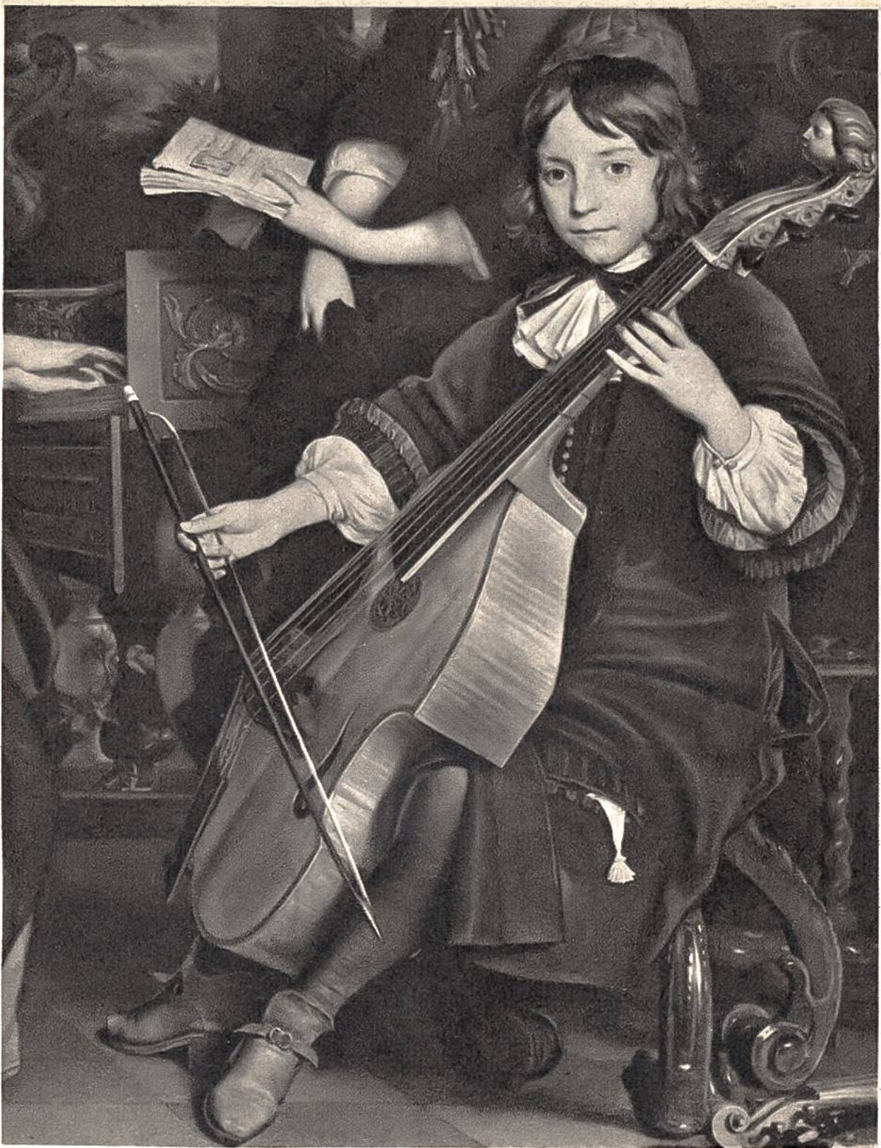
Musizierende Familie (Teilstück), von A. van den Tempel, Amsterdam, 1622–1672. (Rijksmuseum, Amsterdam)