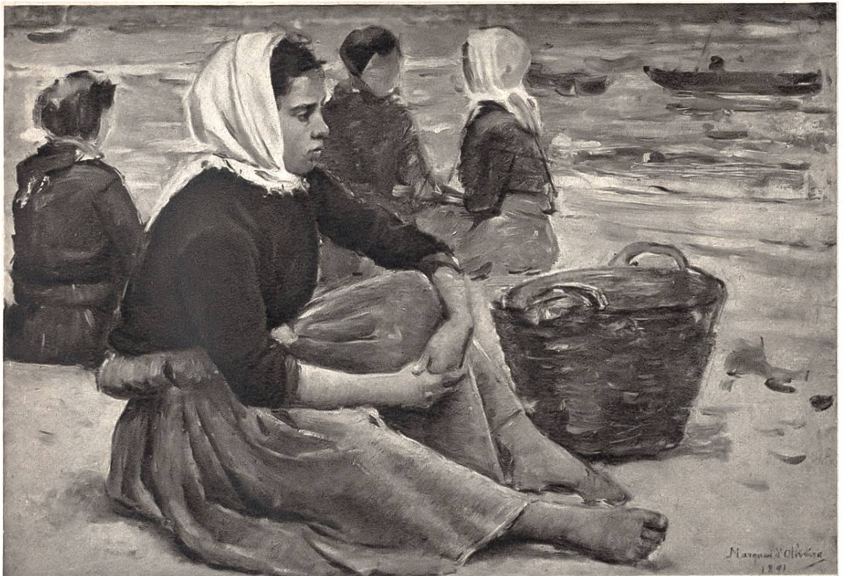
In Erwartung der Fischerbarken, Studie von Marques de Oliveira, Lissabon, 1853–1927. (Nationalmuseum moderner Kunst, Lissabon)