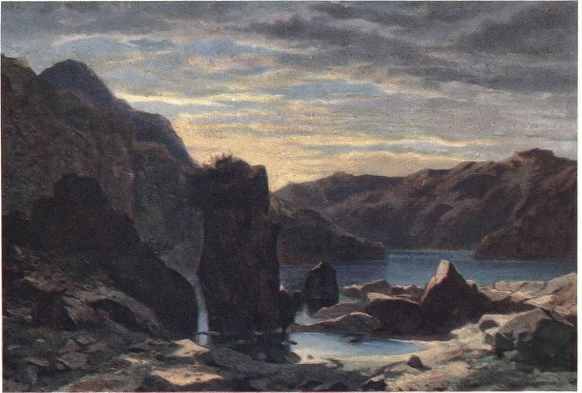
Sonnenuntergang, von Alexandre Calame, * Vevey 1810, † Menton 1864.