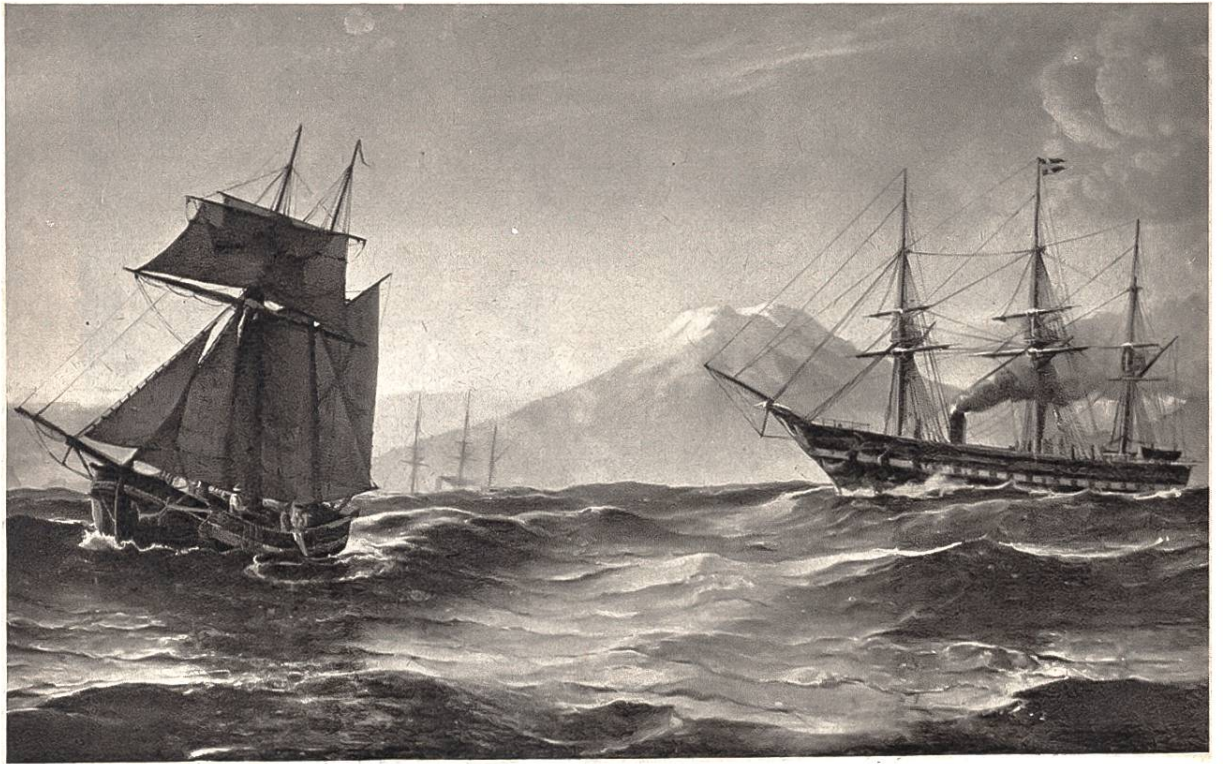
Vor Island, von C.F.Sørensen, Kopenhagen, 1818–1879. (Kunstmuseum, Kopenhagen)