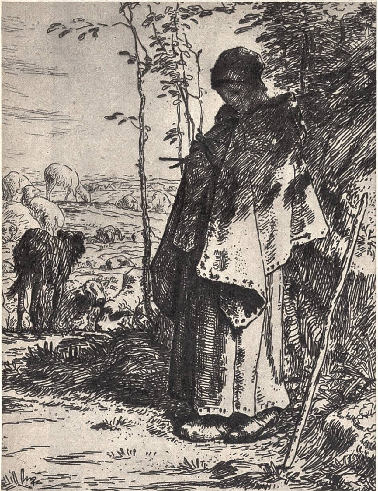
Die Hirtin, Radierung von Jean-François Millet, Barbizon bei Fontainebleau, 1814–1875.