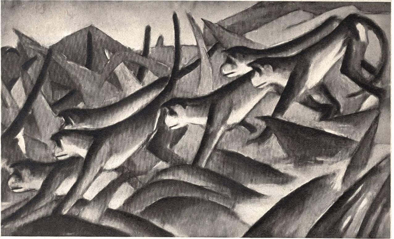
Affenfries, von Franz Marc, München, 1880–1916. (Kunsthalle, Hamburg)