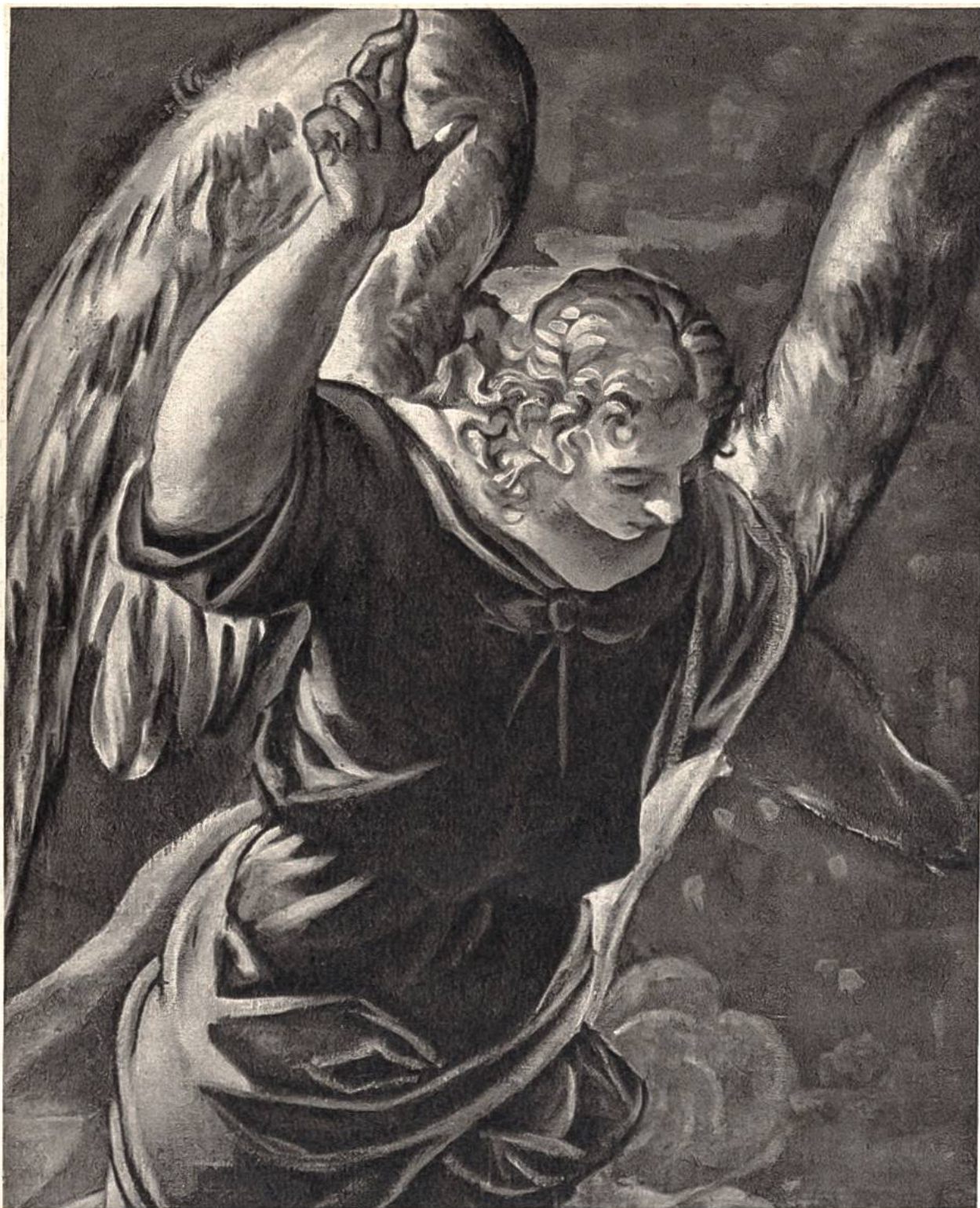
Engel, aus einem Gemälde von Tintoretto, Venedig, 1518–1594. (Rijksmuseum, Amsterdam)