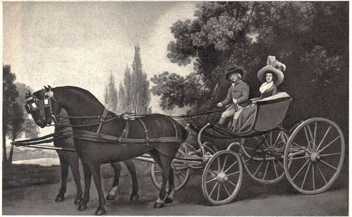
Spazierfahrt im Phaëton (vierrädiger Kutschwagen), von George Stubbs, Liverpool, 1724–1806. (National Gallery, London)