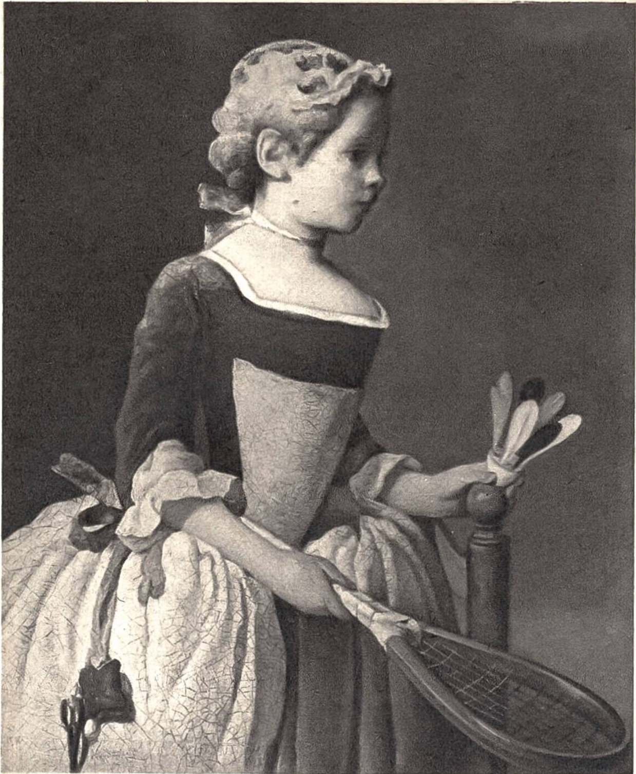
Federballspielerin, von J.B.S.Chardin, Paris, 1699–1779. (Nationalmuseum, Stockholm)