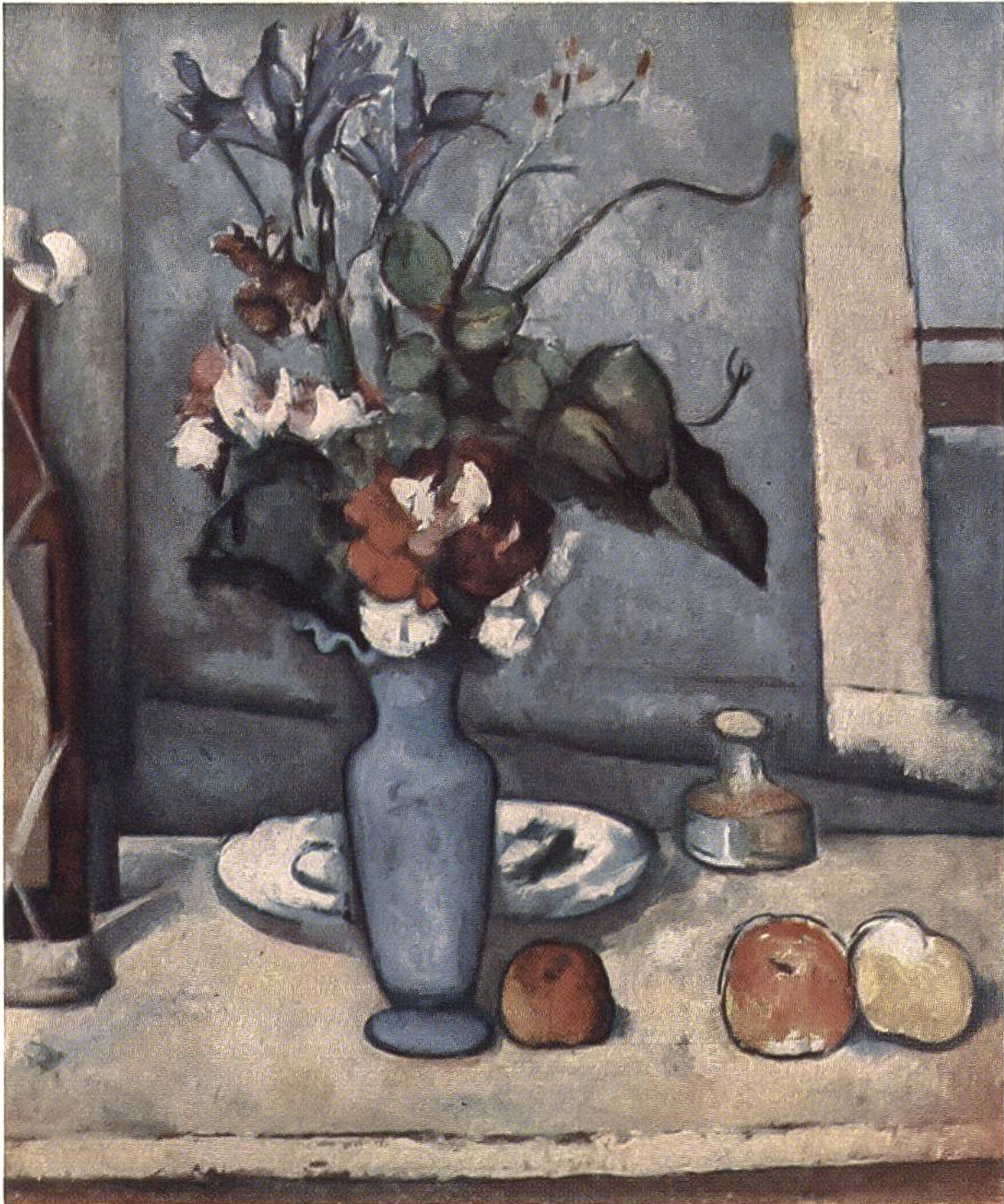
Stilleben mit blauer Vase, von Paul Cézanne, Aix-en-Provence, 1839–1906. (Louvre, Paris)