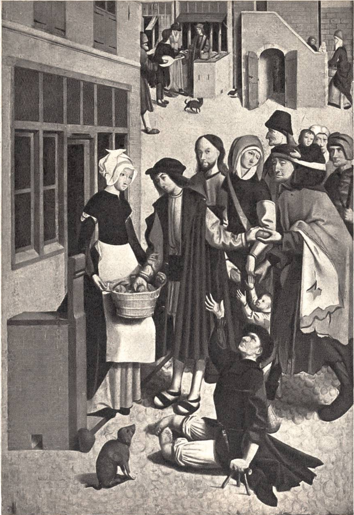
Speisung der Hungernden, Malerei auf Eichenholz vom niederländischen Meister von Alkmaar, vor 1490–1540. (Rijksmuseum, Amsterdam)