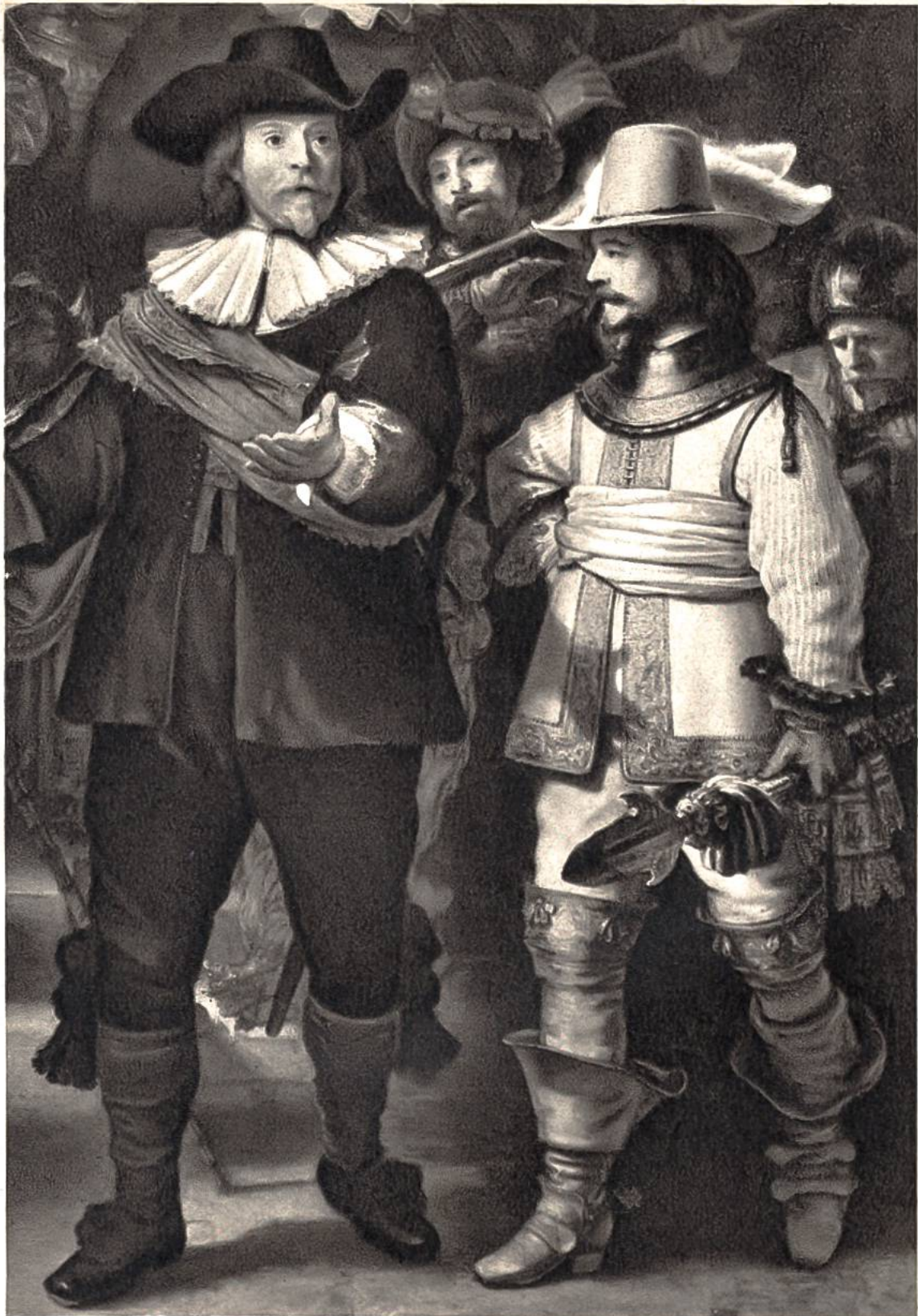
Die Nachtwache (Teilstück), von Rembrandt van Rijn, Amsterdam, 1606–1669. (Rijksmuseum, Amsterdam)