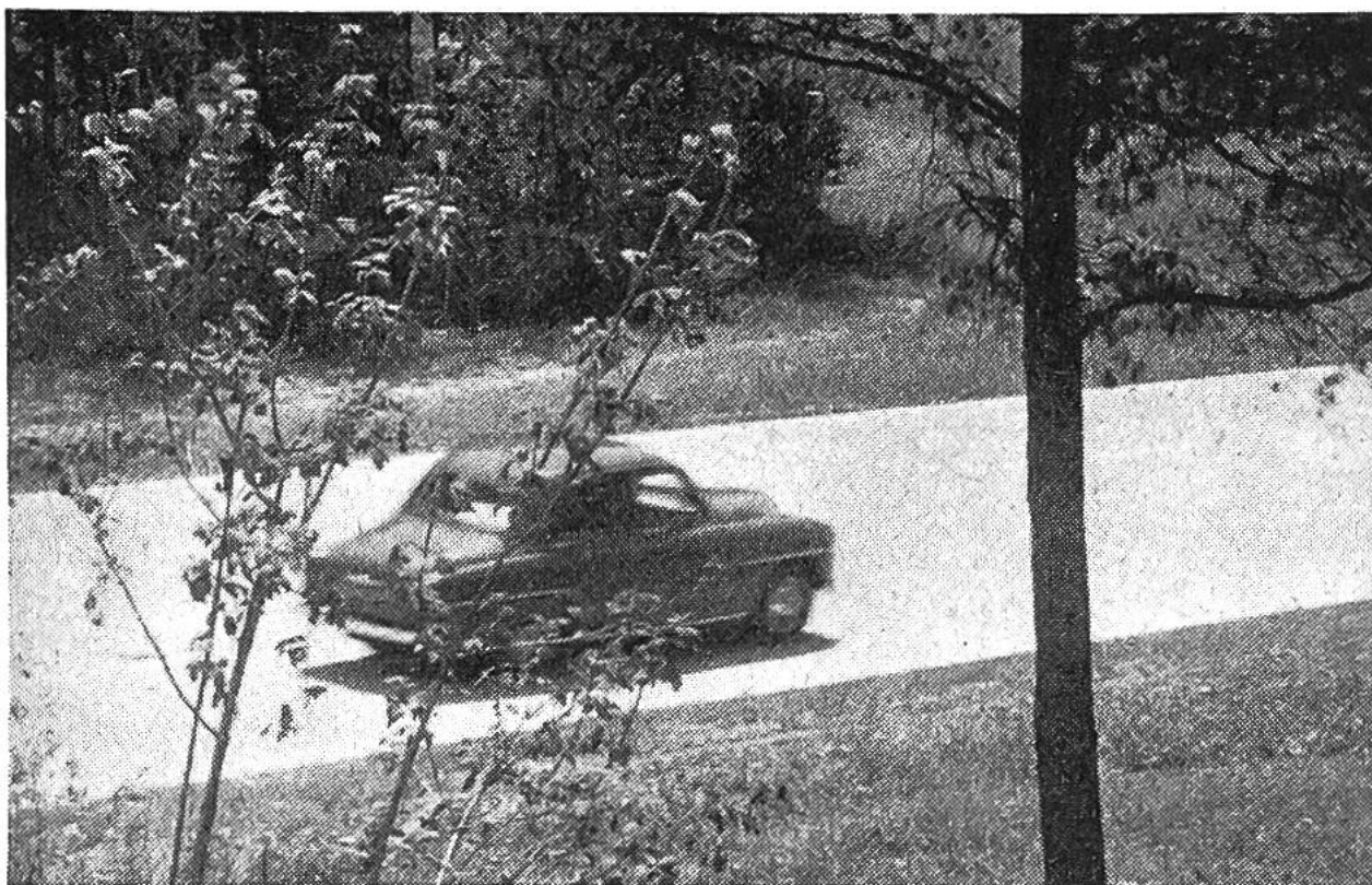
Neun Meter breite Autostrasse Bern-Biel bei Lyss.

Hindernisse auf grössere Entfernung erkennen. Auch bei Nacht und Nässe spiegeln Betondecken nicht. Die Wirkung der lastenverteilenden Platten sichert der Betondecke grosse Tragfähigkeit.