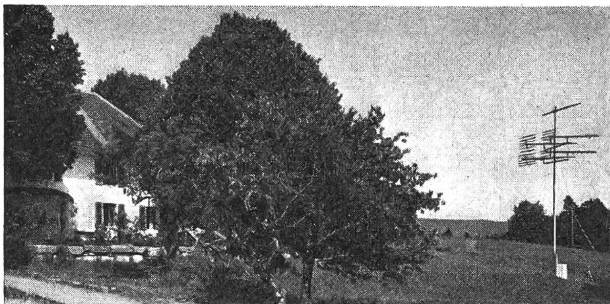
Die Antenne des Drahtfernsehens in Biel steht in erhöhter und störfreier Lage in ländlicher Umgebung und vermittelt deshalb sehr guten Empfang.

auch für die Übertragung von Fernsehprogrammen auf ultrakurzen Frequenzen zu verwenden. Dazu mussten geeignete Vorrichtungen erfunden und andere Anpassungen vorgenommen werden. Diese Arbeiten wurden von Erfolg gekrönt, und es ist somit zum erstenmal in Europa gelungen , das Verteilernetz einer ganzen Stadt ohne Auswechslung der vorhandenen Kabel auch für die Übertragung von drei Fernsehprogrammen zu verwenden. Dabei wird das Netz gleichzeitig von den Abonnenten benutzt, um auch weiterhin nach Belieben drei Radioprogramme niederfrequent zu beziehen, die man mit einem Speziallautsprecher empfängt, oder sechs verschiedene Radioprogramme nach eigener Wahl hochfrequent mit einem normalen Radioapparat durch Anschluss an die Wanddose zu hören.