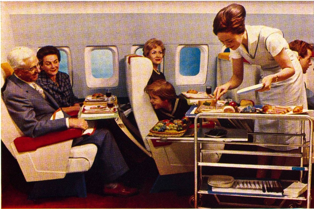
Hostess ist das englische Wort für Gastgeberin. Ihre Hilfsbereitschaft zählt für den Erfolg der Swissair ebenso wie das gute Essen an Bord.