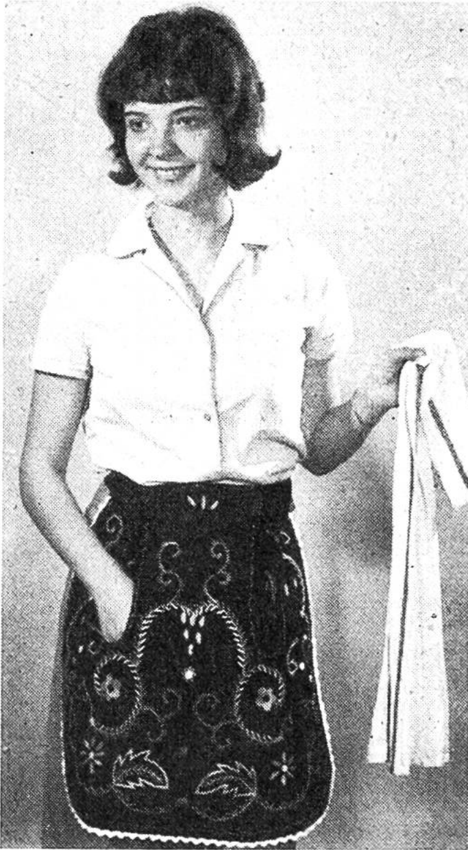
Klammerntasche. Für die bunte Stickerei findet ihr teilweise Zeichnungen auf dem Schnittmusterbogen.

für Muster, die ihr selbst anordnen und nach eigener Phantasie in Stielstich, Hexenstich, Plattstich und Festonstich in verschiedenen Farben sticken könnt.