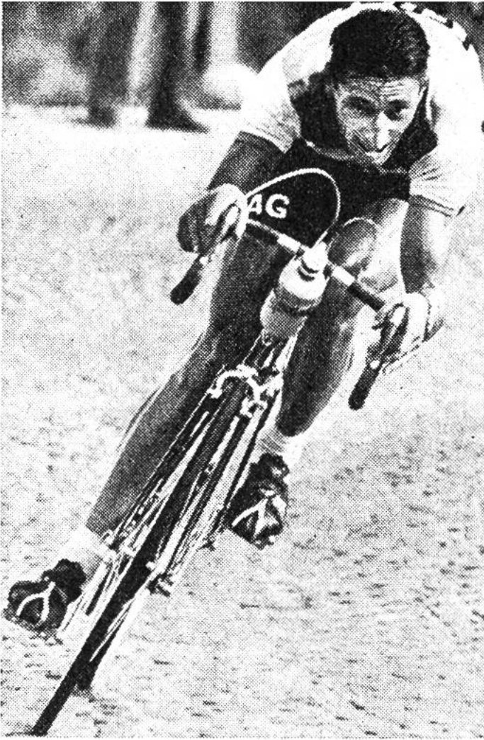
Ferdi Kübler, ein überzeugter Nichtraucher.

werden, dass die ersten Folgen gar nicht lange auf sich warten lassen. Die Leistungsfähigkeit der Kreislauf- und Atmungsorgane des Rauchers nimmt sehr rasch ab. Nur wer nicht Sport treibt, merkt das erst spät. Leider gibt es heute noch Burschen und Mädchen, die ihren Körper verkümmern lassen, weil sie zu bequem sind, sich sportlich zu betätigen. Unter ihnen befinden sich viele Raucher, während unter den aktiven Sportlern meistens Nichtraucher anzutreffen sind. Rauchen lässt sich mit