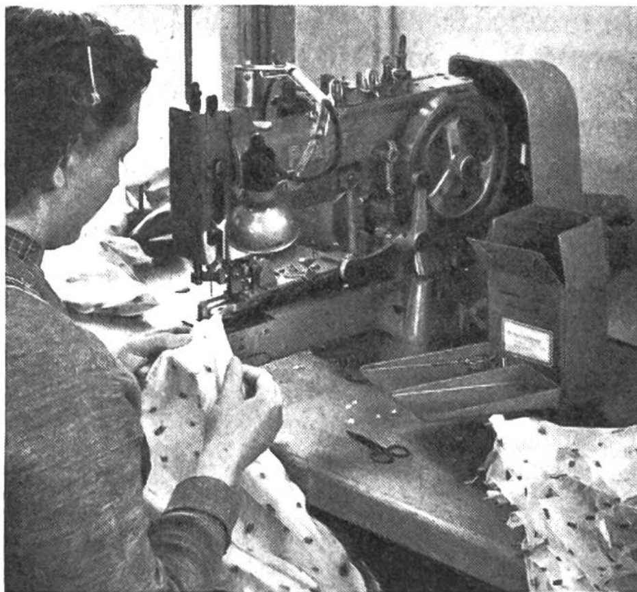
Maschinelles Annähen der Metallspitzen.

leichtere Metallgestell. Dieses wurde in der Folge immer mehr verfeinert und die Stoffe, ihre Farben und Muster der jeweiligen Mode angepasst.