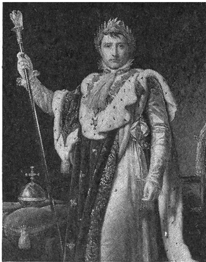
François Gérard (1770–1837): Napoleon im Krönungsornat, nach 1804. Öl auf Leinwand. Napoleon-Museum Arenenberg.