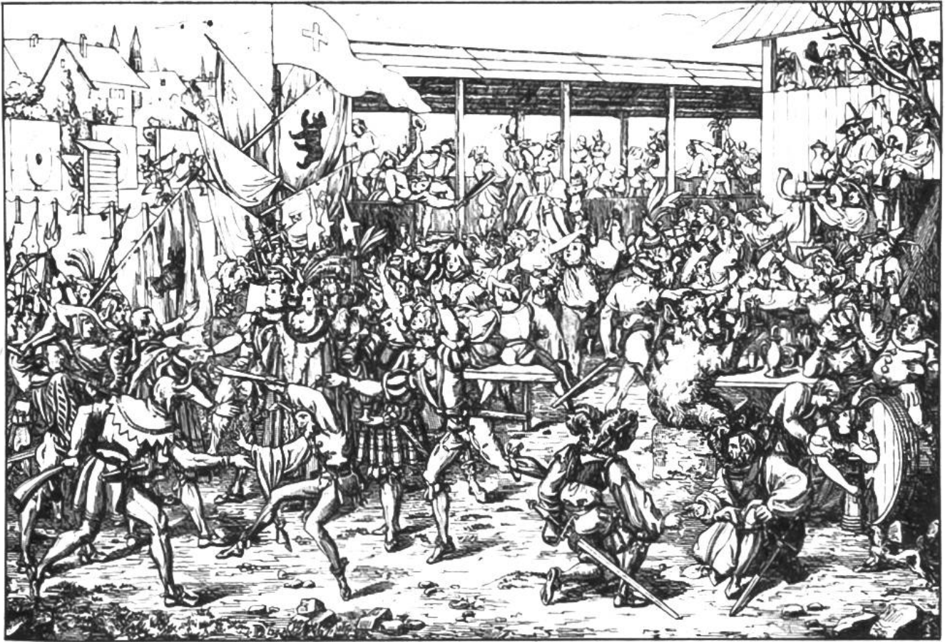
Fastnachts- und Schützenfest in Zürich An. 1454

Wichtigster Teil der Unterhaltung war der «Glückshafen», die Schützenfestlotterie, die viele Leute anzog. Für einen Kreuzer erhielt man einen Zettel, auf den man seinen Namen schreiben musste. Diese Zettel wurden in einen Topf geworfen, in einen andern die Zettel, auf denen die Gewinne notiert waren. Zur Ermittlung der Gewinner zog jemand gleichzeitig aus beiden Töpfen je einen Zettel. Von jedem Gewinn musste ein kleiner Teil abgegeben werden. Davon wurden die Festunkosten bezahlt, etwa Zeiger und Spielleute. Das Freischiessen von 1504 endete mit «Offenen Spielen», Wettbewerben im Laufen, Springen und Steinstossen. Das waren aber keine ernsthaften sportlichen Wettkämpfe, sondern zusätzliche Volksbelustigungen, wie schon die geringen Siegespreise verraten. – Wenige Jahrzehnte nach dem grossen Zürcher Freischiessen brachen unter den Eidgenossen die bitteren Glaubenskämpfe aus; die Zeit für freundschaftliche Schützenreffen war damit vorbei. Andreas Kappeler