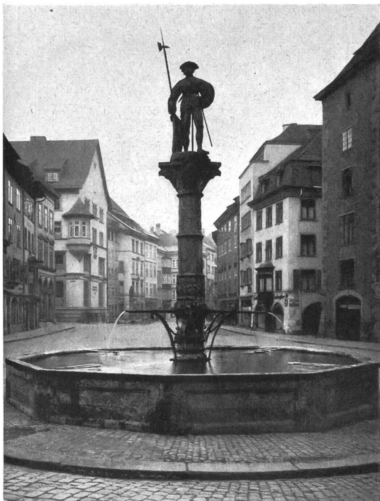
Brunnen auf dem Fronwagplatz in Schaffhausen