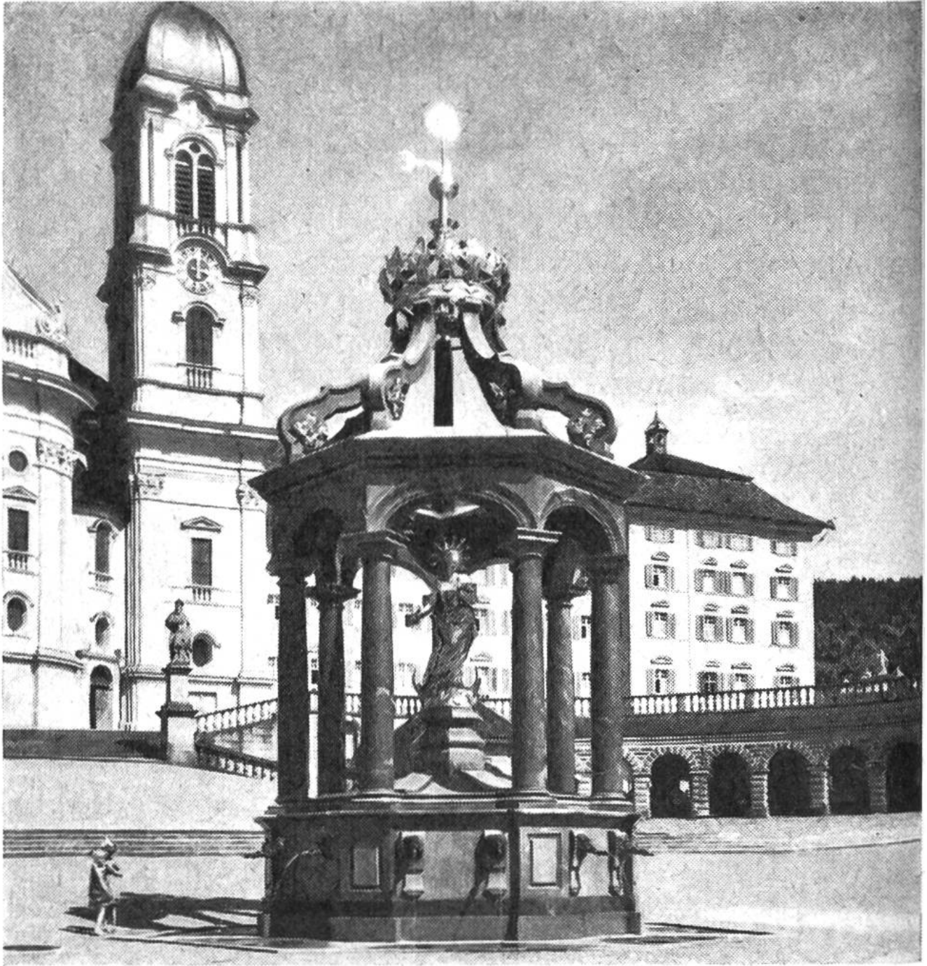
Liebfrauenbrunnen in Einsiedeln von 1686

Maria auf den Brunnen, um seine Verehrung für die Muttergottes zu bezeugen. So steht die Maria im Liebfrauenbrunnen vor der Stiftskirche von Einsiedeln (Abb. 2) von 1686 auf einem kleinen Podest inmitten von Säulen wie in einer offenen Loggia. Durch 14 Wasserspeier fließt das Wasser in einen flachen Trog. Der ganze Brunnen ist hier wie ein richtiger Bau angelegt und zeigt, wie der Barockstil auch ein einfaches Werklein als Gesamtkunstwerk errichtet.