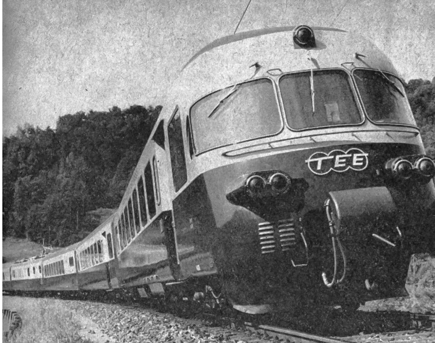
Der Vierstrom-TEE-Zug der SBB.

gleiche Stromart aufweisen. Die Schweizerischen Bundesbahnen – und zum grossen Teil auch die Deutsche Bundesbahn sowie die Österreichischen Bundesbahnen – verwenden Einphasen-Wechselstrom (15000 V 16\frac{2}{3} Hz). Die Italienischen Staatsbahnen dagegen fahren mit Gleichstrom (3000 V), die Französischen mit einem anderen Gleichstrom (1500 V) sowie mit Einphasen-Wechselstrom (25000 V 50 Hz). In Zentraleuropa sind für den Betrieb der elektrischen Hauptbahnen gegenwärtig nicht weniger als vier verschiedene Stromsysteme gebräuchlich. Alle vier reichen bis an die Schweizergrenze.