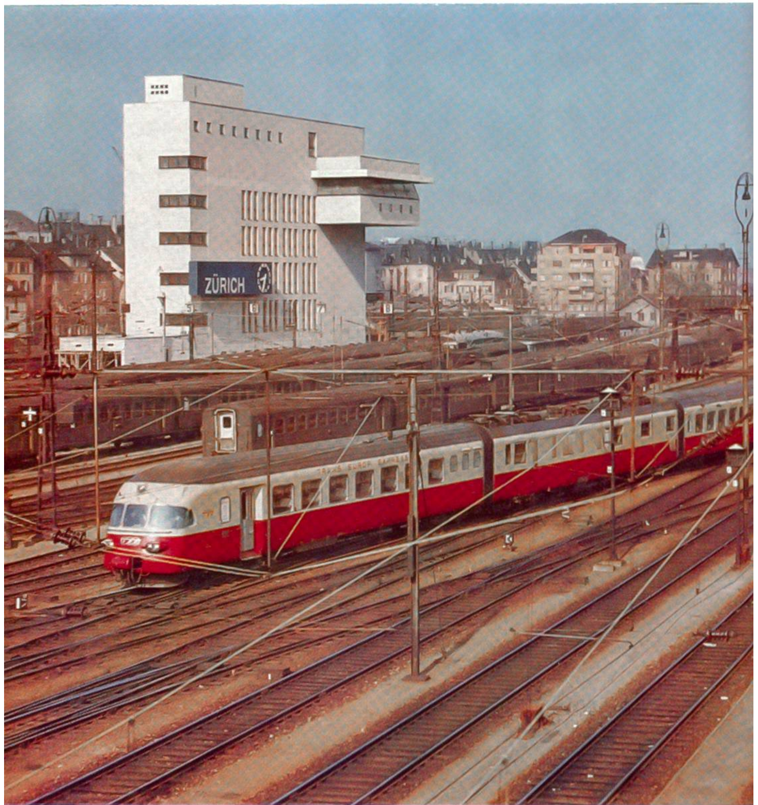
Modernster Zug und modernste Stellwerkanlage: Der Trans-Europ-Expresszug «Gottardo» wird in Zürich vom neuen elektrischen Zentralstellwerk aus sicher über die vielen Weichen geführt.