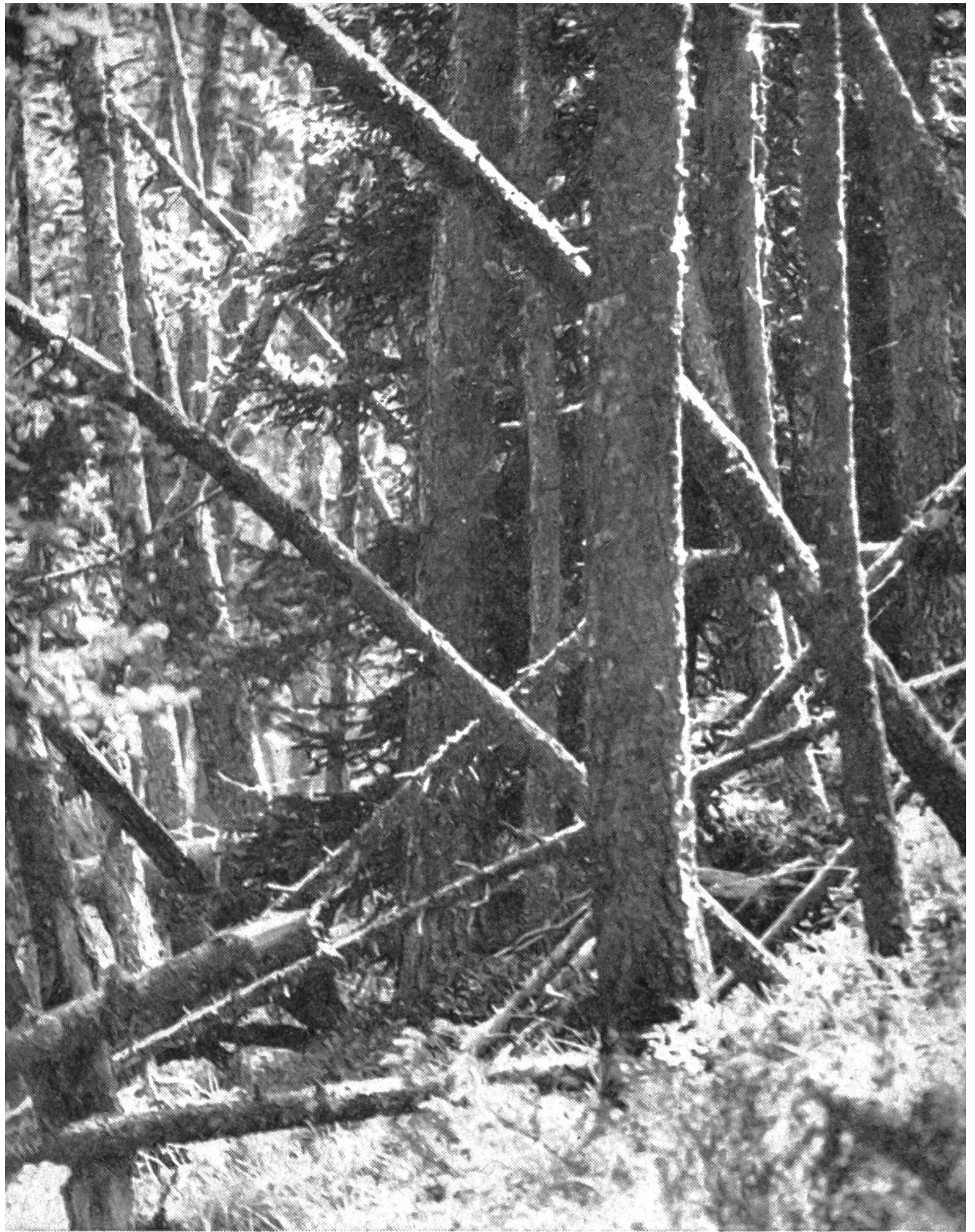
Urwald am hinteren Spöl. Abgestorbene Bäume stürzen und bleiben liegen. Der Mensch darf nicht in das natürliche Geschehen eingreifen.