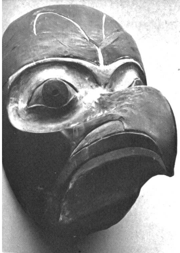
Tanzmaske der Haida-Indianer, Queen-Charlotte-Insel (Kanada).