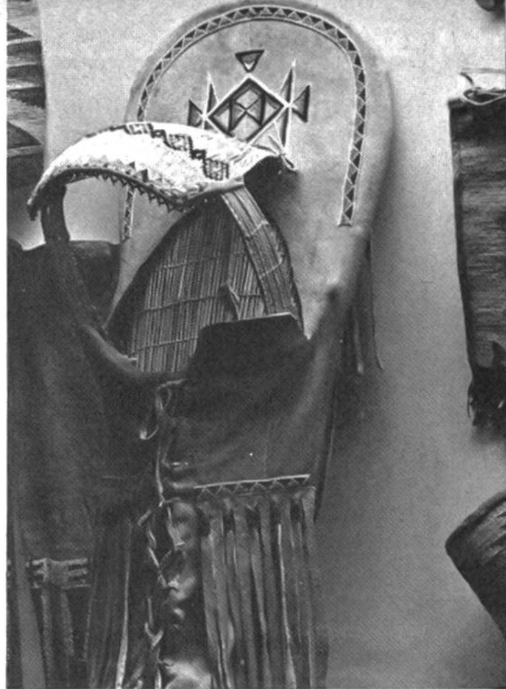
Kindertragtasche, Das Kind wurde wie auf einem Räf auf dem Rücken der Mutter mitgetragen.