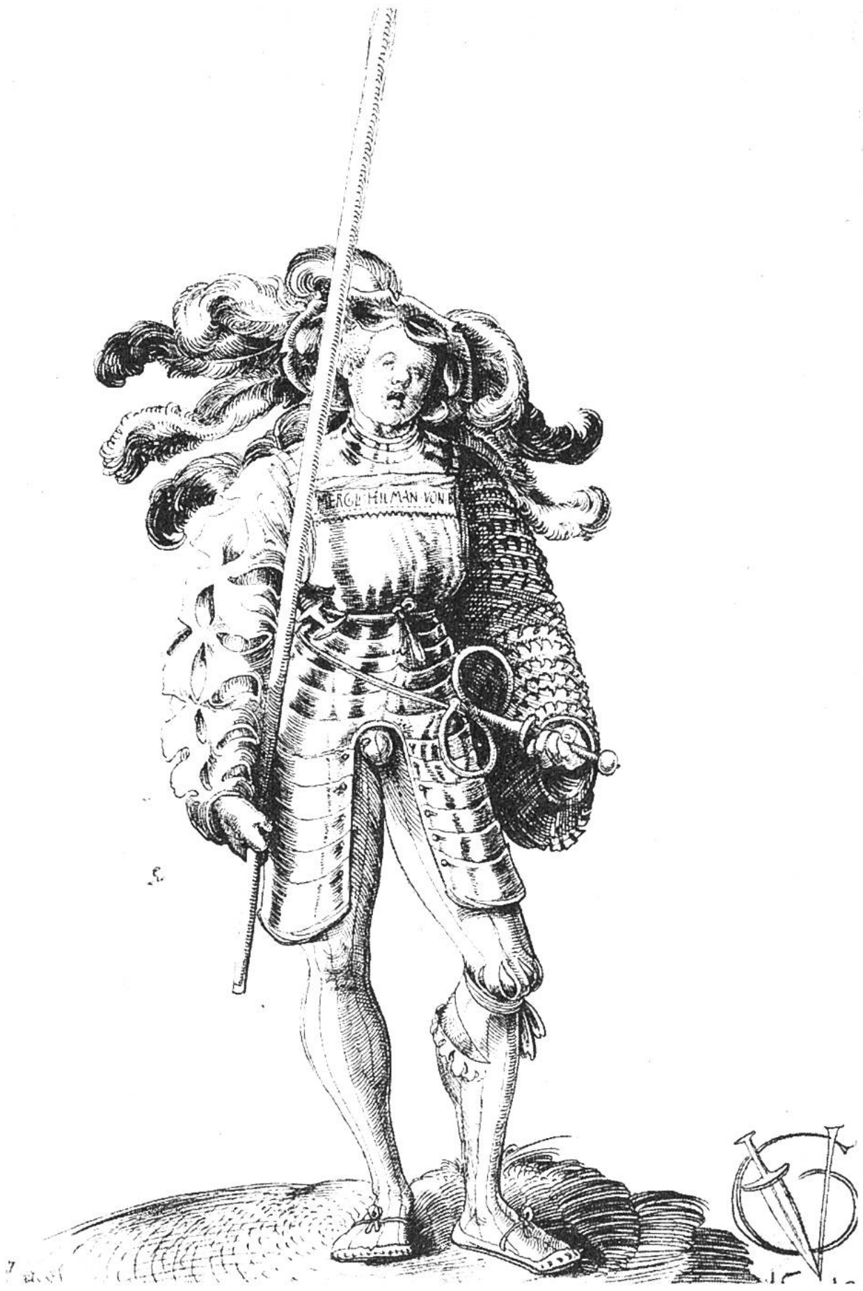
Krieger in Brust- und Beinharnisch