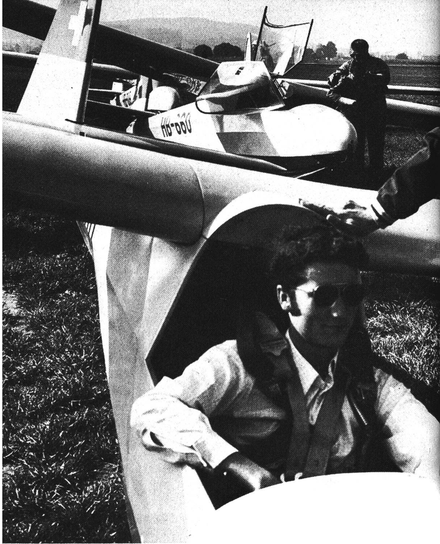
Startvorbereitungen auf dem Birrfeld.