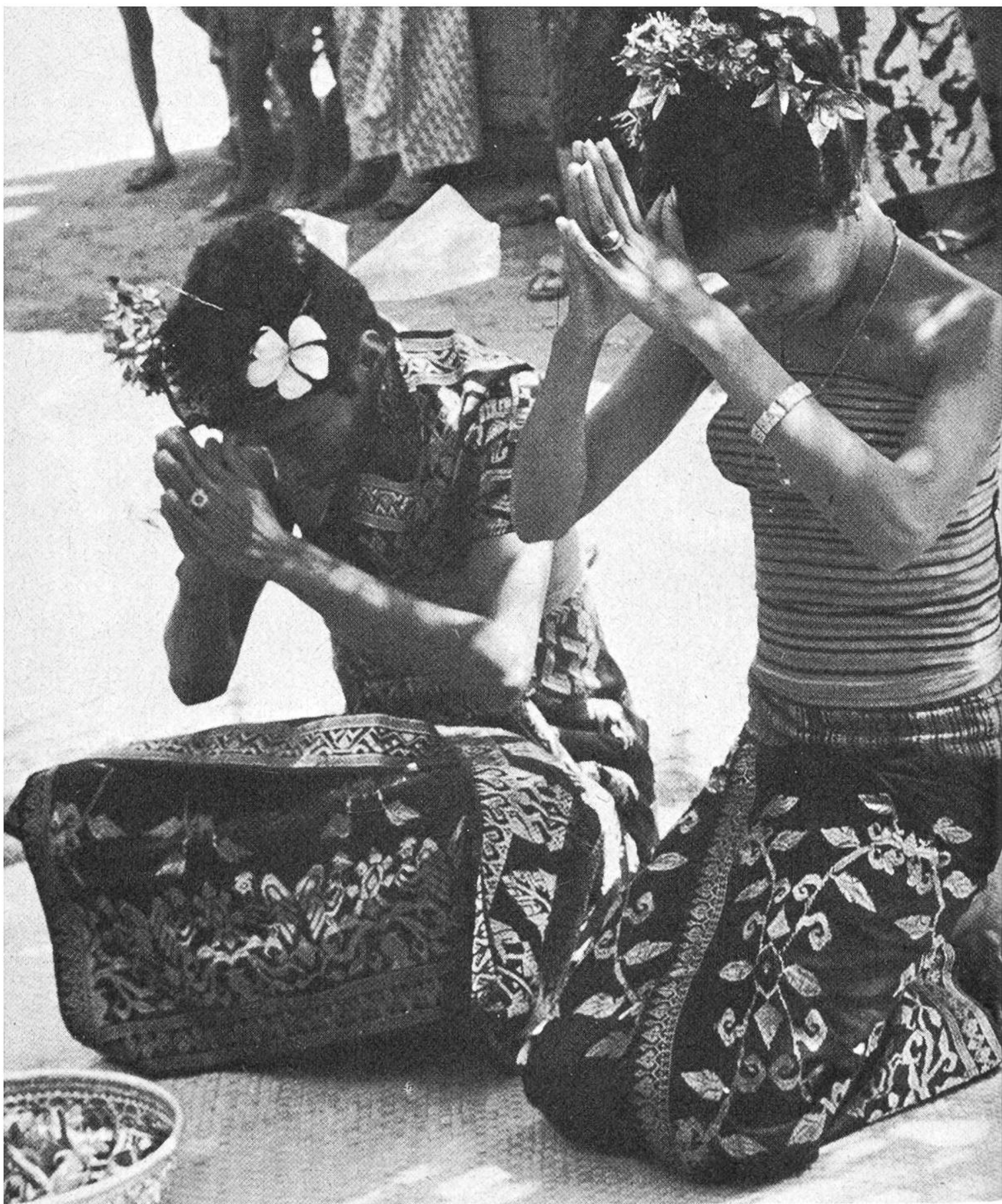
Balinesisches Brautpaar bittet um den Segen der Priesterin.