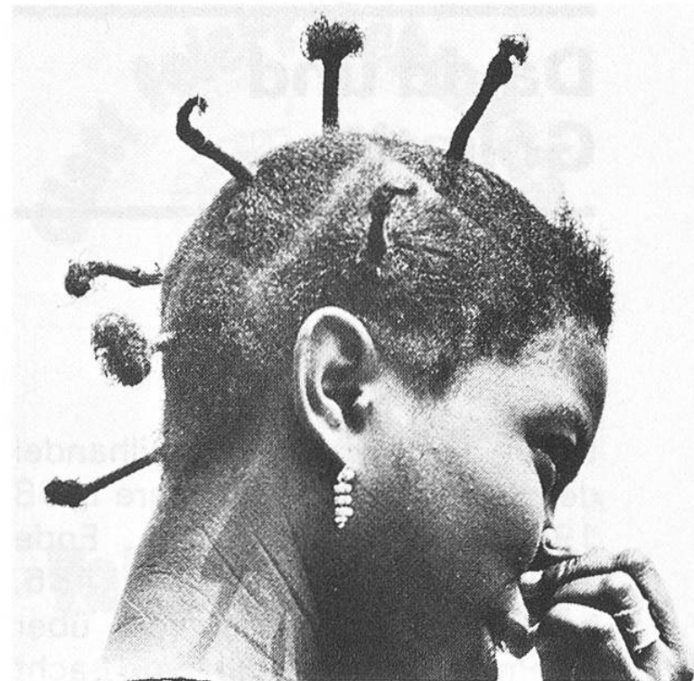
... ob Sträusschen oder ...

... ein langgezogener Chignon – jede dieser Haarspielereien hat ihren künstlerischen Reiz.