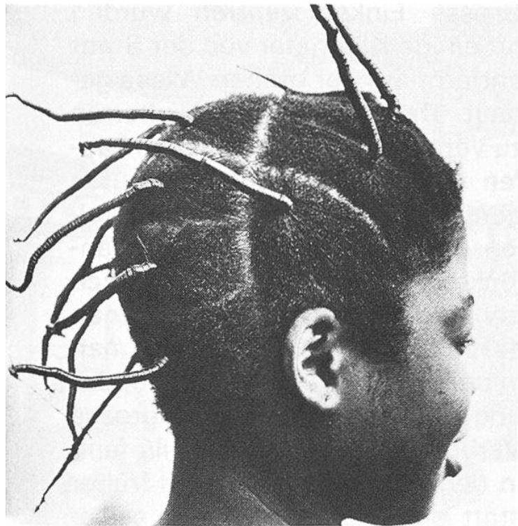
... ob Haarstacheln ...