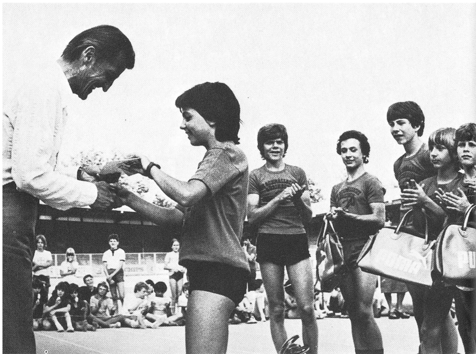
Siegerehrung und Preisverteilung.

sein Ziel: Zürcher waren in den Sprintstrecken bei den Leichtathletik-Meisterschaften wieder führend und holten Titel.