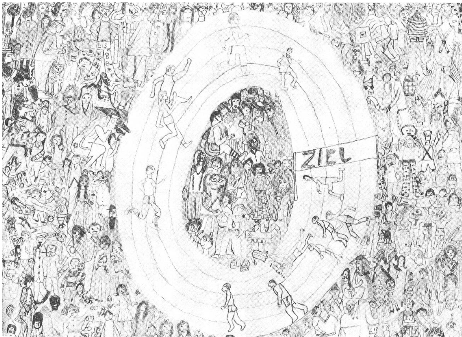
So sehen Kinder ihren eigenen Wettbewerb: Zeichenwettbewerb für «de schnällscht Zürihegel».

die Ansicht vor, Frauen hätten auf dem Sportplatz nichts zu suchen), ab 1956 führte man auch Stafettenläufe durch. Einige Zahlen: Der Wettbewerb begann 1951 mit 112 Knaben, 1955 waren es 450 Knaben und 72 Mädchen. Das Rekordjahr war 1974 mit 1736 Knaben, 1629 Mädchen und 369 Staffeln. 1973 und 1975 waren die Mädchen gegenüber den Knaben in der Überzahl. Auch bei den Mädchen siegten