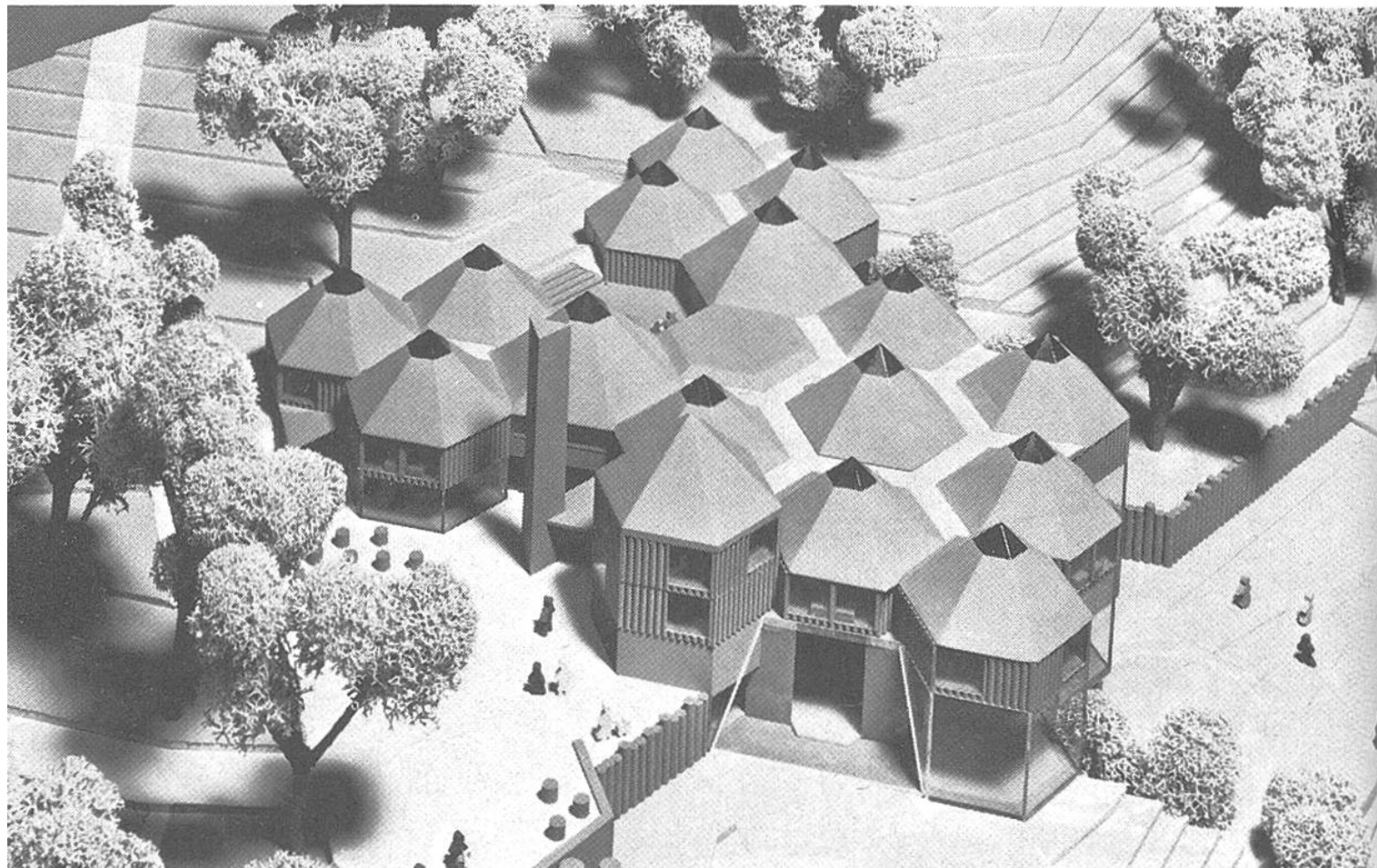
Das Modell des neuen Ferienzentrums auf dem «Twannberg» oberhalb des Bielersees.

tungsrat der Aktion (Ärzte, Fürsorger, Juristen, Radiomitarbeiter) noch bei keinem Gesuch hat nein sagen müssen.