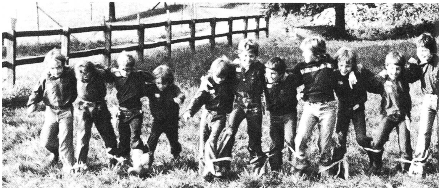
Die letzten Meter der Gugelhopf-Olympiade an der Wolfsübung.

fe und die vier Leiter am Bahnhof in Zürich von Robinson begrüsst. Unser Besuch freute ihn sehr, da er Hilfe bei der Kokos-Ernte brauchte. Dann fuhren wir mit dem Zug nach Robinsonien. Nachdem wir das Haus bezogen hatten, suchten sich die drei Gruppen ihre Plätze. Sie gaben sich neue Namen: Crusoe, Bärenfell und Kannibalen. Für die Dekoration unseres Hauses machten wir viele Zeichnungen über Robinson.