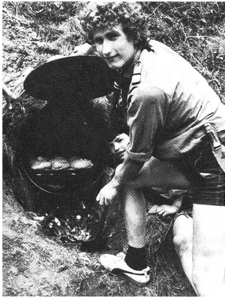
Die ersten sechs Brote aus unserem Superbackofen.

wir unter kundiger Anleitung mit der Teigherstellung. In einer grossen Pfadipfanne mischen wir im richtigen Verhältnis Ruchmehl, Weizenschrot, Salz, Hefe und Wasser und fangen an wie wild zu kneten. Danach lassen wir den Teig eine halbe Stunde aufgehen. Inzwischen wird dem Backofen kräftig eingeheizt. Er besteht aus einem grossen Fass, dessen Deckel aufklappbar ist; das Fass ist in den Hang eingegraben. Der Backofen kann von unten durch ein Feuer geheizt werden. Jetzt kann jeder vom fertigen Teig selber ein