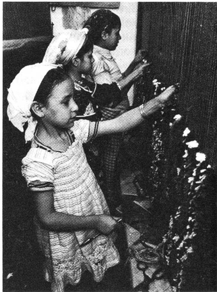
Kuschelweiche Wollteppiche werden in Marokko von kleinen Mädchen geknüpft: Statt zur Schule gehen diese Achtjährigen in die Fabrik.

tes Übel auf dieser Erde. Dabei gibt es Kinderarbeit seit Urzeiten. In der Familie übertrug man den Kindern je nach Alter und Können stets wieder bestimmte Arbeiten, die sie im Dienste der Gemeinschaft verrichteten, welcher sie selber angehörten. Die meisten Kinder waren deswegen nicht überfordert, weil sie dabei überblicken konnten, was sie zu tun hatten, und sie durften dabei gewisse Fertigkeiten entwickeln und so ihr Selbstvertrauen stär-