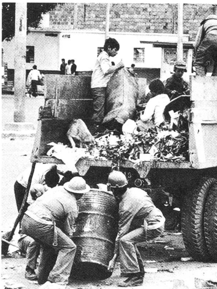
Vom Abfall der Reichen müssen die Armen leben: Auf einem Kehrichtauto in Bogotá durchstöbern Jugendliche den Unrat nach brauchbaren verkäuflichen Dingen.

Überhaupt: Die Ausbeutung der Kinder ist ein sehr dunkles Kapitel in der Sozialgeschichte fast aller Industrieländer. Dazu gehört auch die Schweiz. 1815 waren beispielsweise im Kanton Zürich 1124 Kinder im Schulalter in Spinnereien beschäftigt. Bei einem Arbeitstag von meist mehr als zwölf Stunden war es naheliegend, dass auch die älteren Fabrikkinder kaum lesen und schreiben konnten. Im Jahre 1815 erliess der Regierungsrat eine «Verordnung wegen der minderjährigen Jugend in den Fabriken überhaupt und an den Spinnmaschinen besonders». Doch die Fortschritte, die sie brachte, waren gering: Verbot der Fabrikarbeit für Kinder vor dem vollendeten 9. Altersjahr, Festlegung der täglichen Arbeitszeit bis zum vollendeten 16. Altersjahr auf 12 bis 14 Stunden, Verpflichtung des Vaters, sein in der Fabrik beschäftigtes Kind an der Repeiterschule und an der Kinderlehre teilnehmen zu lassen. Die Nachtarbeit wurde nur indirekt verboten, indem ohne Festsetzung des Arbeitsschlusses bestimmt wurde, mit der Arbeit dürfe im Sommer nicht vor fünf, im Winter nicht vor sechs Uhr begonnen werden. Ein weiterer Anlauf, die Kinder von den schlechten Aus-