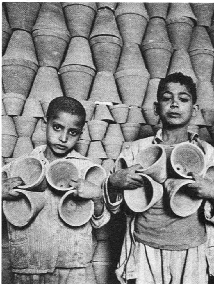
Kinder in einer ägyptischen Ziegelei: Sie stapeln die Tontöpfe im Brennofen und räumen ihn aus.