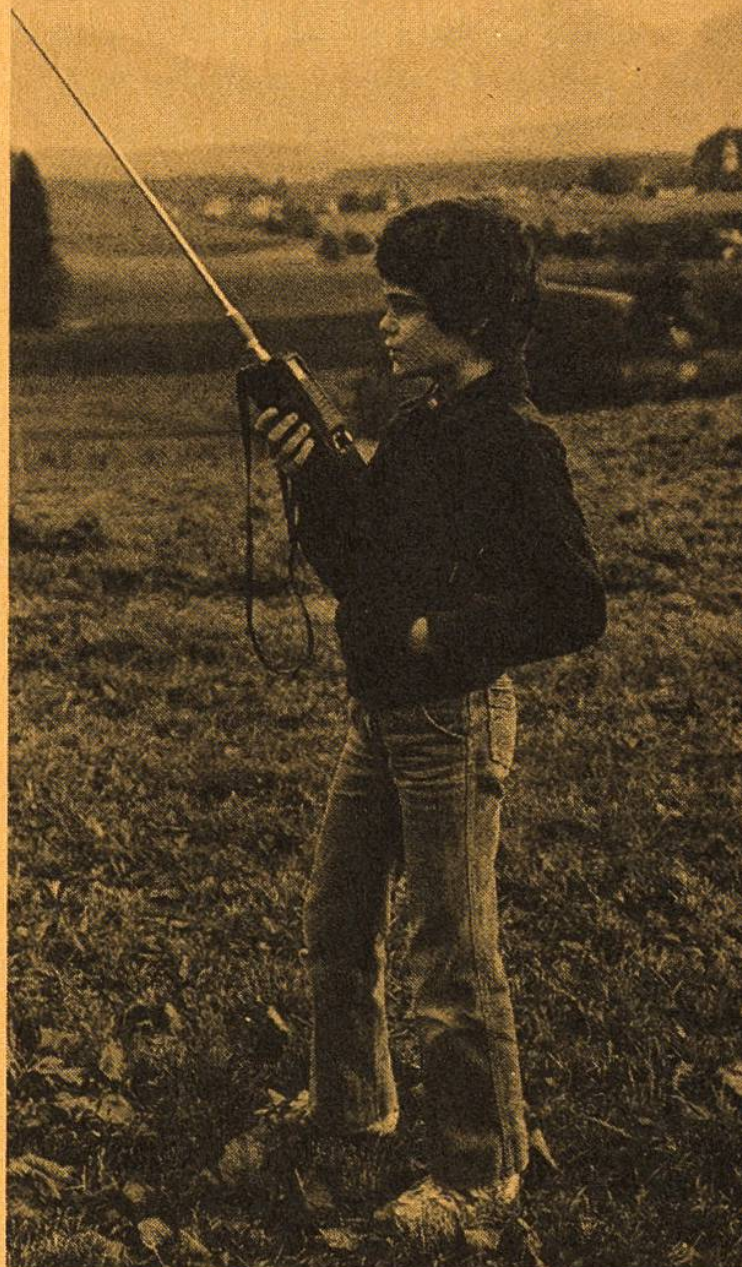
Erhöhte Standorte mit freier Sicht übers Land sind für die Ausbreitung der Funkwellen besonders günstig.

Gross wird die Versuchung sein, den ausländischen Funkfreund per Tastendruck anzurufen, doch dies ist leider untersagt. Überdies reicht die Sendeleistung unserer kleinen Handfunkgeräte in den meisten Fällen nicht aus, den fernen Funker zu erreichen. Aber – eine Inlandverbindung vom Sän-