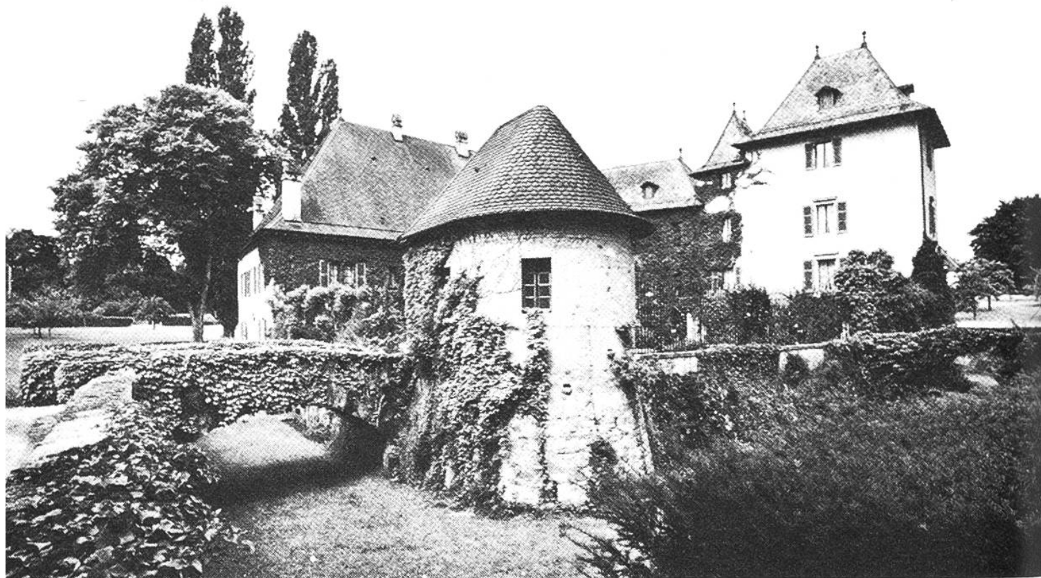
Tournay GE. Blick in die Hof- und Gartenpartie. Im Vordergrund der bis ins Mittelalter zurückreichende Graben. Die Brücke ist neuzeitlich. Im Unterbau der einzelnen Gebäude und der Umfassungsmauer stecken noch Teile aus dem 14. und 15. Jahrhundert. Das vordere Gebäude erhebt sich auf einem alten Eckturm.

en, zum Kennenlernen mittels Büchern vor.