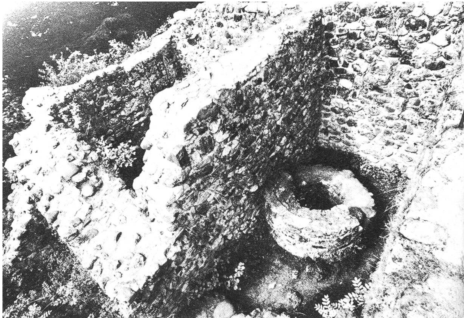
Die Ruinen der sogenannten «Gesslerburg» liegen bei Küssnacht SZ auf einer Hügelrippe. Von der einst stattlichen Feste zeigt unser Bild den restaurierten Sodbrunnen.

all herein, wenn auch die schmalen Fensteröffnungen mangels einer Verglasung mit Brettern verschlossen waren. Den eigentlichen Mittelpunkt der Burg bildete die Feuerstelle. Man ging frühzeitig zu Bett. Geschlafen wurde auf Strohsäcken, eingehüllt in Decken und Pelze. Fand eine Belagerung statt, so hing das Leben der Burgbewohner vom Lebensmittel- und Trinkvorrat ab. Schon im 14. Jahrhundert ermöglichten Wurfgeschütze und auch Pulverwaffen rasche und gründliche Stürme auf die Burgen. Viel-