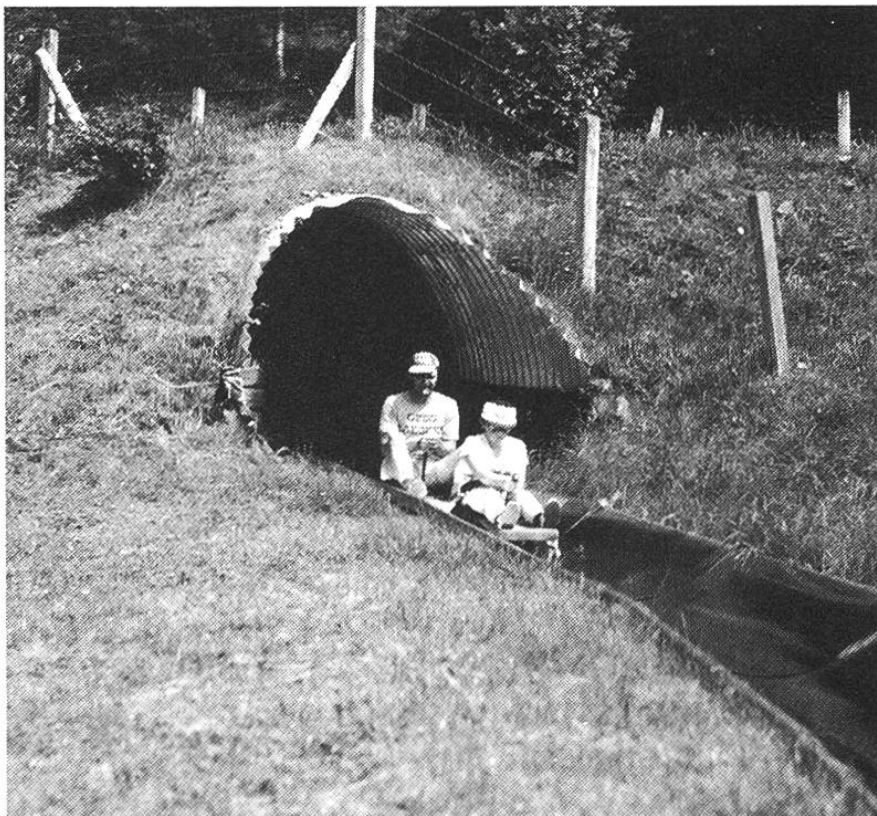
Am Rutschen auf der Sommerbobbahn finden nicht nur Jugendliche, sondern selbst Erwachsene grossen Spass.

Der Atzmännig ob Goldingen im Kanton St. Gallen, im Grenzland zwischen Linthgebiet und Zürcher Oberland gelegen, ist ein vielbesuchtes Ausflugsziel, im Winter fürs Skifahren und Langlaufen, im Sommer fürs Wandern. Besonders beliebt ist die aussichtsreiche Gratwanderung von der Bergstation (1200 m.ü.M.) über Schwammegg, Rotstein und Tweralp-spitz (1332 m.ü.M.) bis zur Chrüzegg, mit herrlicher Rundschau auf die Linthebene, den Zürichsee, die St. Galler-, Appenzeller-, Glarner-, Schwyzer- und