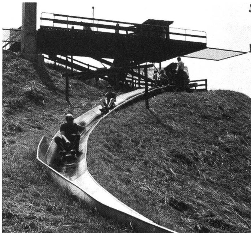
Bei der Mittelstation der Atzmännig-Sesselbahn nimmt das grosse Rutschvergnügen seinen Anfang.

Doch am Atzmännig tut sich mehr als nur Skifahren im Winter und Wandern im Sommer. Hier gibt's vom Frühling bis in den Herbst hinein, etwas total Verspieltes, Einmaliges. Da rutschen die Leute auf dem Hintern die Alpweide hinunter, und das ohne Grasflecken abzukriegen. Von der Sesselbahn-Mittelstation windet sich ein glänzendes Band über die steile Bergwiese, hinab bis zur Talstation. Und zwar mehrheitlich in einem für die Alpwirtschaft schlecht zu nutzenden Graben, so dass sich der Eingriff in die Natur in Grenzen hält; denn sonst wäre die Baubewilligung nicht erteilt worden. Dieser 700 Meter lange Tatzel-