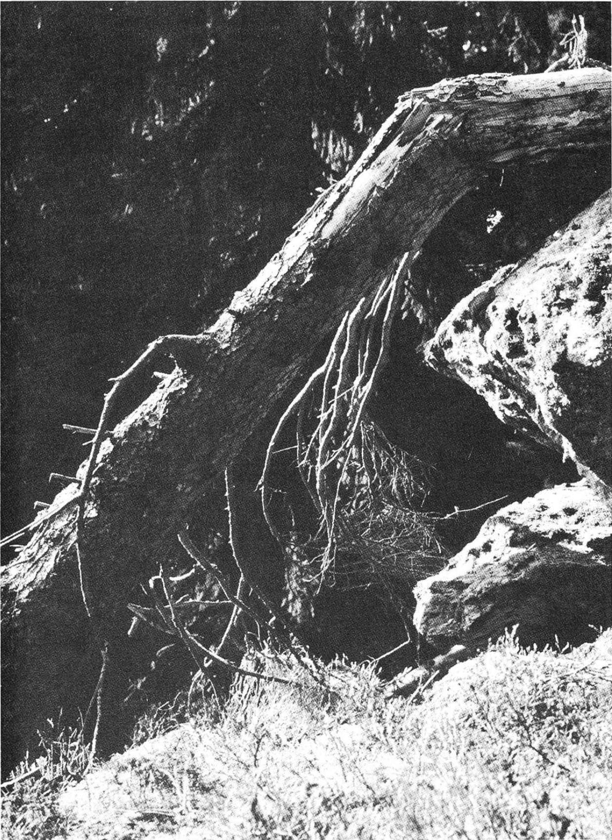
Der Urwald liegt auf einer steilen, mit Blöcken eines nacheiszeitlichen Bergsturzes übersäten Halde. Kein Wunder, dass er nie genutzt wurde.