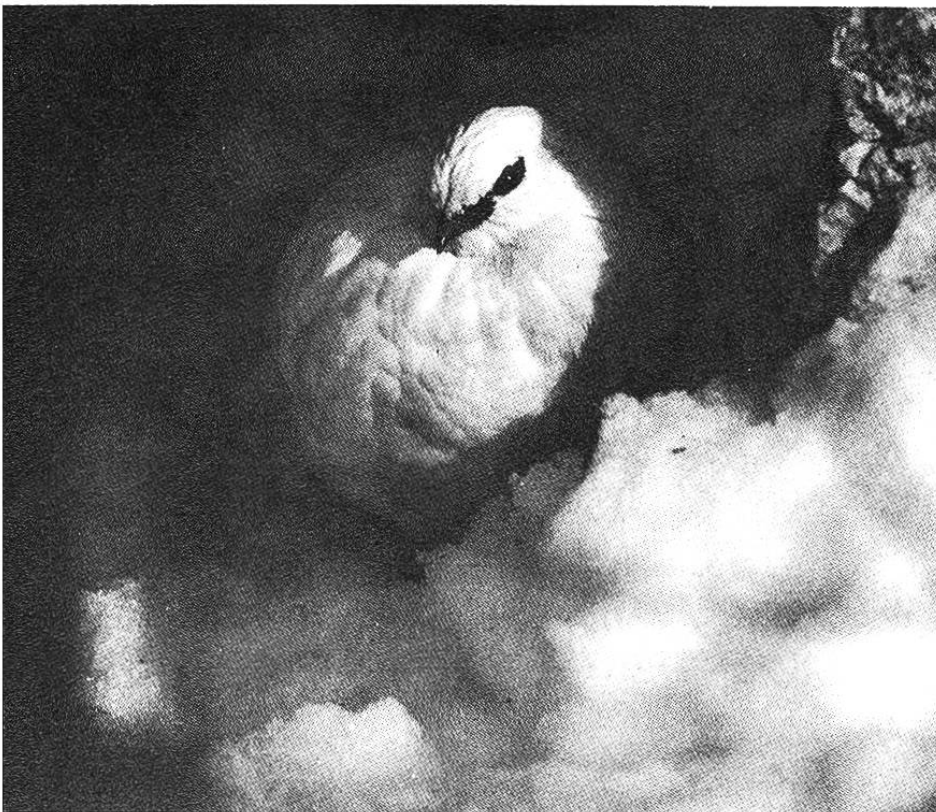
Aufgeplustert und im Windschutz verbraucht das Schneehuhn wenig Energie.

Aufgeschreckte Birkhühner geraten wie die Gemsen in Panik und fliegen oft weite Strecken, bevor sie sich beruhigen. Schon das können sich die schlecht ernährten Vögel kaum leisten. Noch schlimmer aber