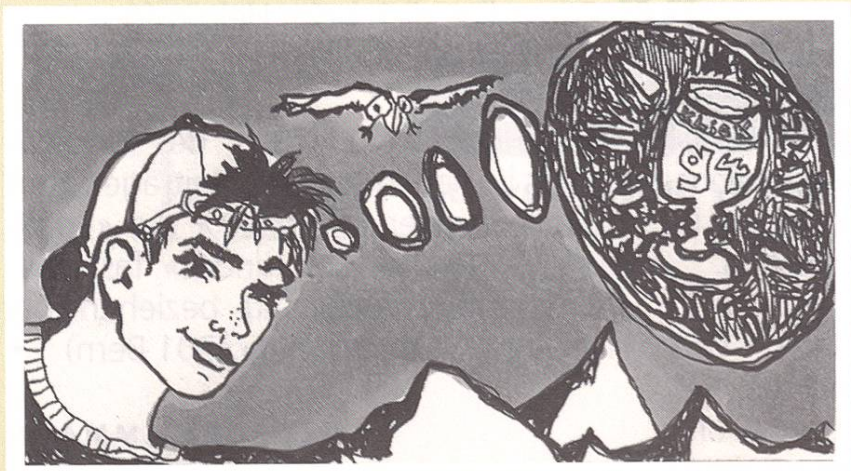
ILLUSTRATION: CORINNE HÄCHLER UND NADINE SPENGLER