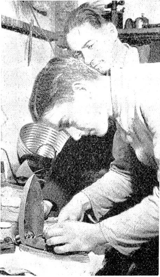
Der Fachmann gibt dem künftigen Elektroinstallateur Gelegenheit, ein reparaturbedürftiges Bügeleisen zu untersuchen.

aus den eigenen Verstand und die eigene Urteilskraft zu gebrauchen. Ich weiss, dass schon Elf- und Zwölfjährige häufig an ihren künftigen Beruf denken und davon träumen, für sich und andere auf ihrem späteren Arbeitsfeld einmal etwas Besonderes zu leisten. Solchen möchte ich empfehlen, einen Teil ihrer Freizeit der „Berufsforschung“ zu widmen. Dieser Sport ist mindestens so interessant, ja spannend, und ebenso belehrend wie das Markensammeln. Der „Berufsforscher“ schreibe zuerst einmal alle Berufe auf, die ihm bekannt sind, und zeichne auf dieser Liste jene an, die er unter Umständen selber ausüben möchte. Dann samle er in einer Mappe alle Bilder und Zeitungsnotizen,