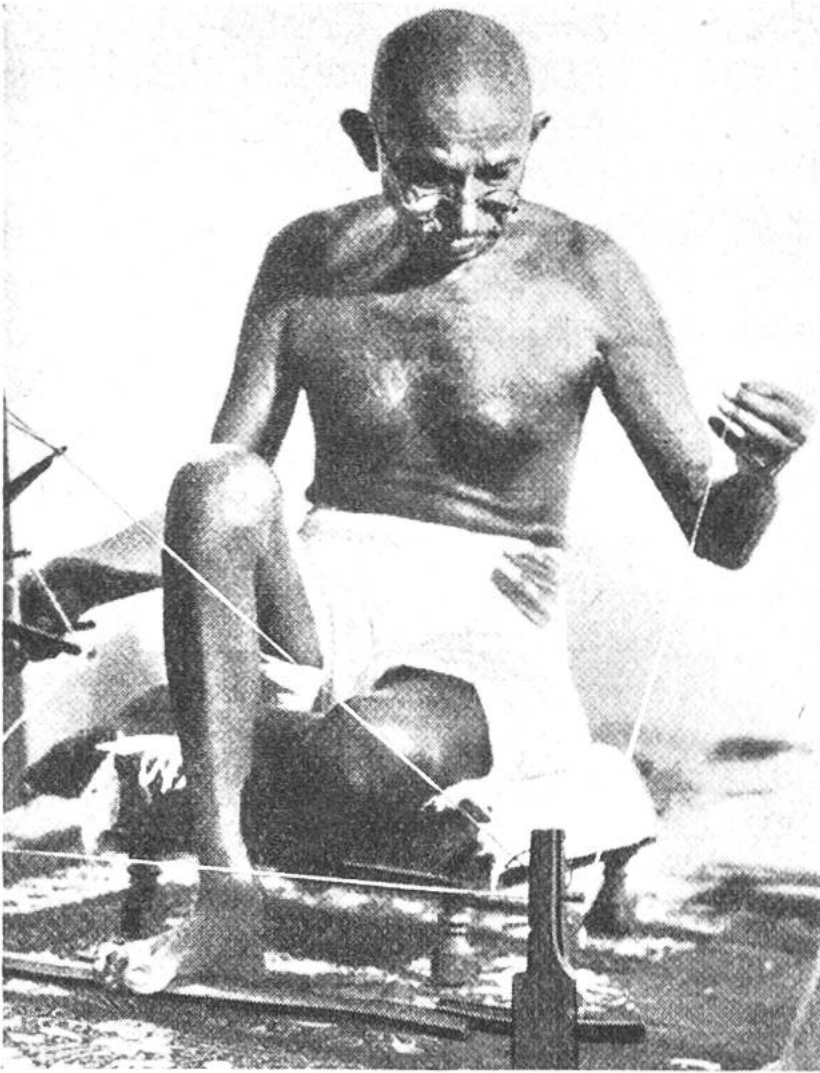
Gandhi am Spinnrad. Mit der Einführung des häuslichen Spinnens verschaffte er zahllosen Familien Verdienst.

dischen Volksepos Mahabharata, wie auch die Bergpredigt kennen, die einen gewaltigen Eindruck auf ihn ausübte. Nach seiner Rückkehr nach Indien wurde er Fürsprecher in Rajkot und in Bombay.